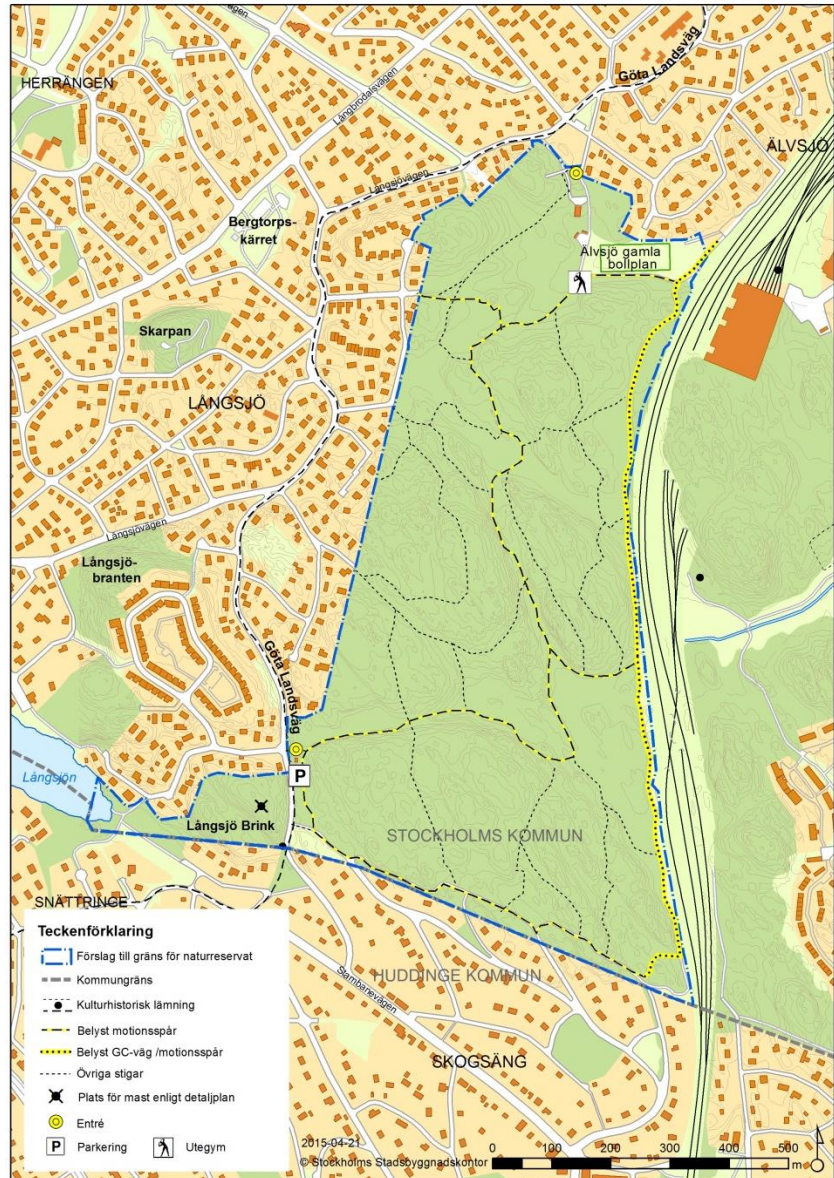
Figur 1: Förslag till gräns för Älvsjöskogens naturreservat