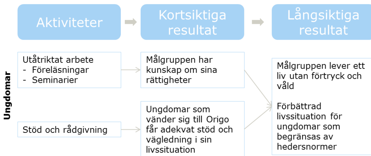
Figur 2 – Förenklad förändringsteori för Origos verksamhet för ungdomar