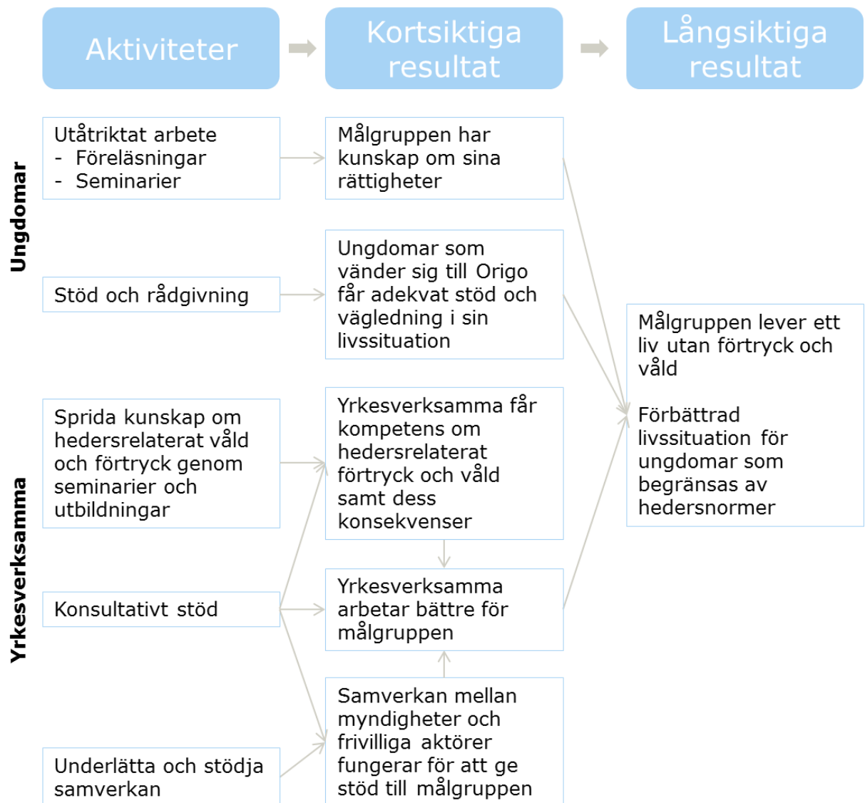
Figur 1 – Förenklad förändringsteori för Origo