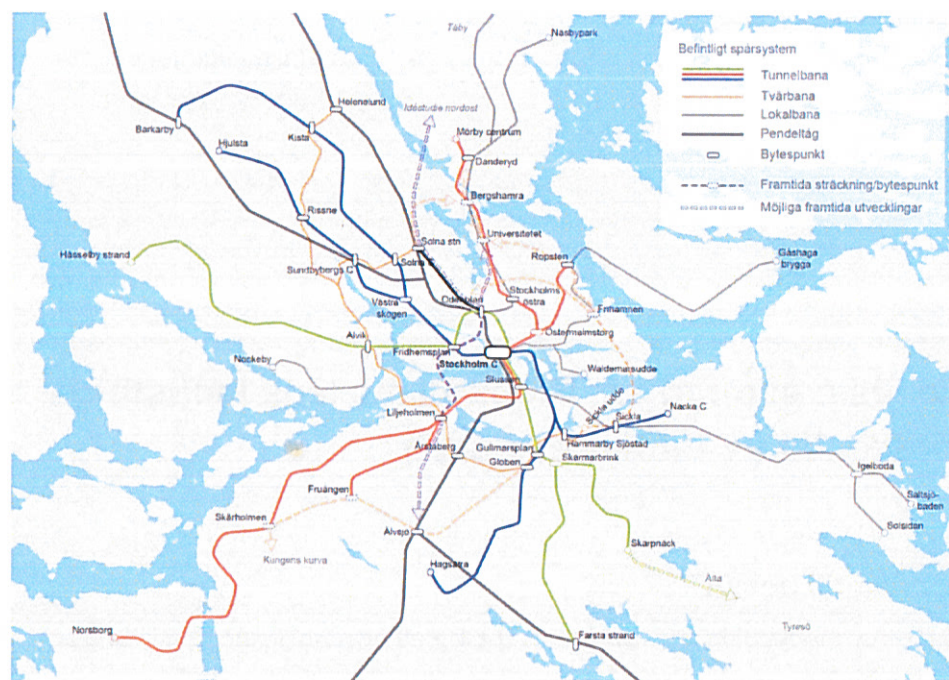
Figur 35. Långsiktig utblick för spårsystemets utveckling från Landstingets stornätsplan för Stockholms län, etapp 2 (2014)

med anläggandet av en ny depå. En sådan förlängning finns med i Landstingets stornätsplan 1 i en utblick bortom år 2030.