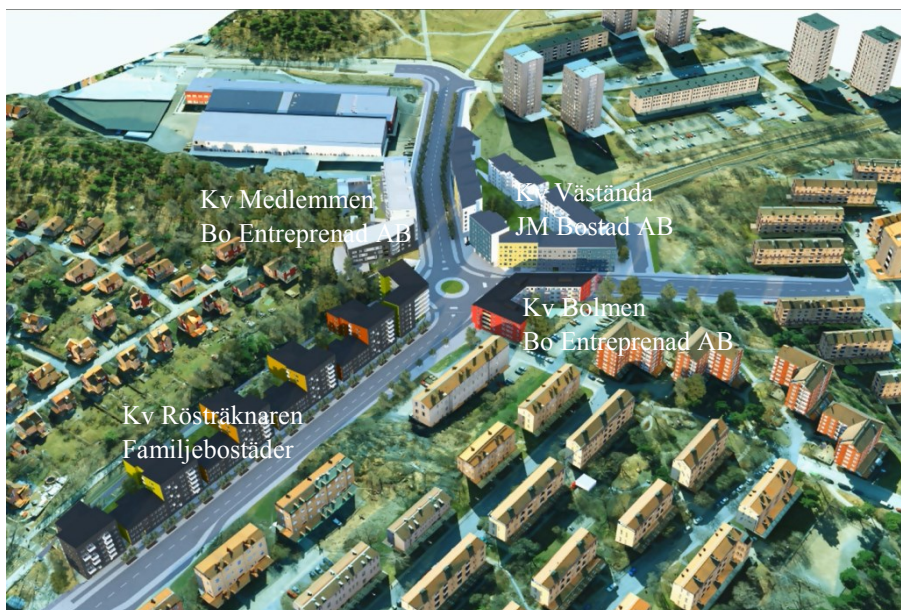
Utbyggd Årstastråket etapp 1, www.stockholm.se/arstastraket