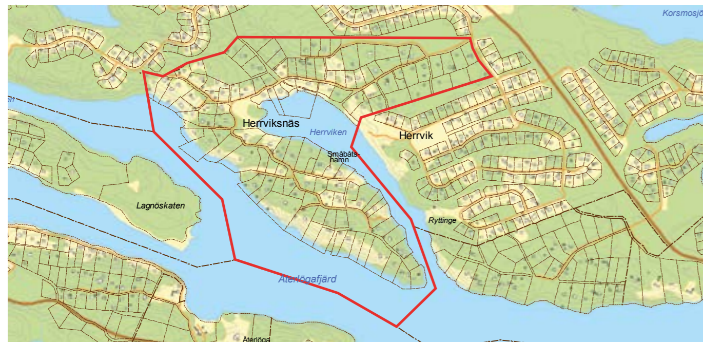
Illustration över område som i programmet kallas för Herrviksnäs, delområde S3.

En behovsbedömning har utförts med en tillhörande checklista för miljöfrågor. Detaljplanen bedöms inte innebära några påtagliga risker för människors hälsa. Inga miljö kvalitetsnormer bedöms överskridas och planen medger heller inte någon förändring av något naturområde som har skyddsstatus. Sammanfattningsvis bedöms planens genomförande inte ge någon betydande miljöpåverkan och en miljökonsekvensbeskrivning enligt miljöbalken behöver därför inte upprättas. Genom utredningar av undervattensmiljön i Herrviken kan områden lämpliga för placering av bryggor fastställas (åtgärden kräver dock strandskyddsdispens och