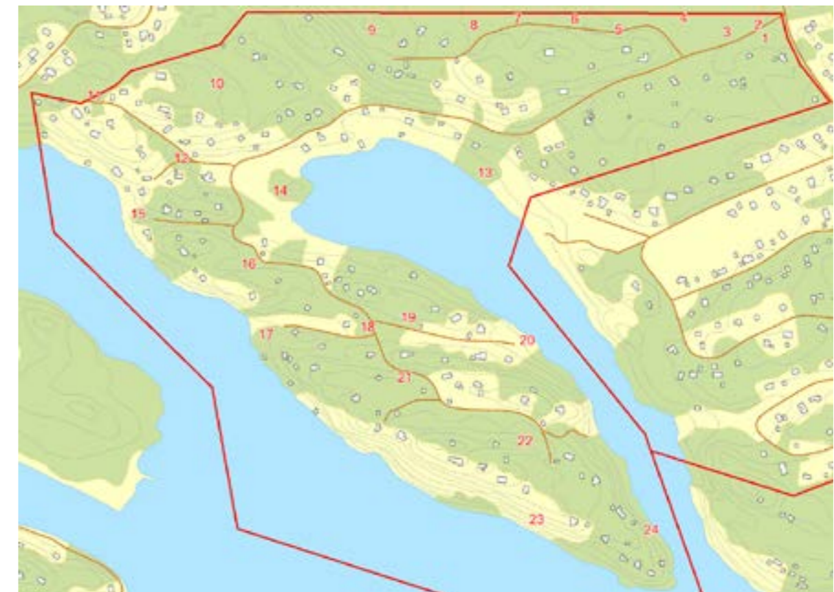
Kartan ovan visar olika naturområden i Herrviksnäs. Se bilaga Naturbeskrivning för mer information.

En naturinventering för området utfördes under september 2012 och har sedan uppdaterats i juni 2014 efter att samhällsbyggnadskontoret önskat djupare kunskap om vegetationen i Herrviksnäs. Området består av förhållandevis kuperad terräng med barrdominerad blandskog, tallbevuxna bergsryggar och sluttningar ner mot Herrviken. Vegetationen består främst av senvuxna, gamla tallar, friskare skog med varierande barr- och lövskogar samt surdråg med sumpvegetation. Det finns en del ädellövträd, främst ek, men även ask och fågelbär, inom området. En del av ekarna är undertryckta av främst uppväxande gran och asp. Området består av en del större grönområden samt naturpartier mellan fastigheterna i det kuperade området med en, i de flesta fall naturskogsartad karaktär med inslag av gamla och värdefulla träd.