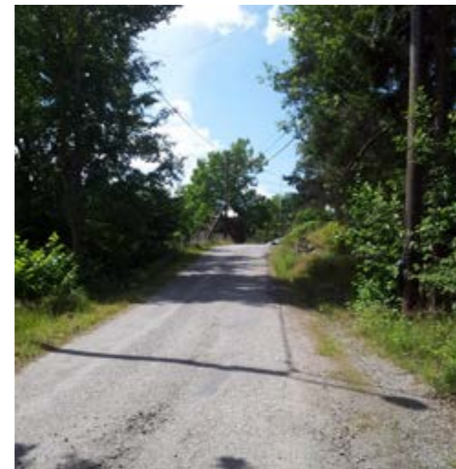
Befintligt gatunät inom planområdet.

En ökning av andelen hårdgjorda ytor behöver undvikas. Det är viktigt att dagvattnet fortsättningsvis omhändertas lokalt inom området så som idag på växtbeklädd tomtmark och vägdike innan utlopp till recipienten Herrviken med åtanke att Herrviken betecknas som en känslig recipient. Herrviken är en mindre havsvik och planområdet ligger i direkt anslutning. Se vidare om dagvattenhanteringen under rubriken Teknisk försörjning. Den sammantagna ekologiska statusen för Herrviken klassificeras till ”måttlig” enligt framtagen undervattensinventering (2013, Svensk Ekologikonsult AB). Vikens ekologiska status klassas i samma inventering som ”god”. Denna klassning bör användas med försiktighet då tillräckligt antal arter för klassificering endast återfanns vid