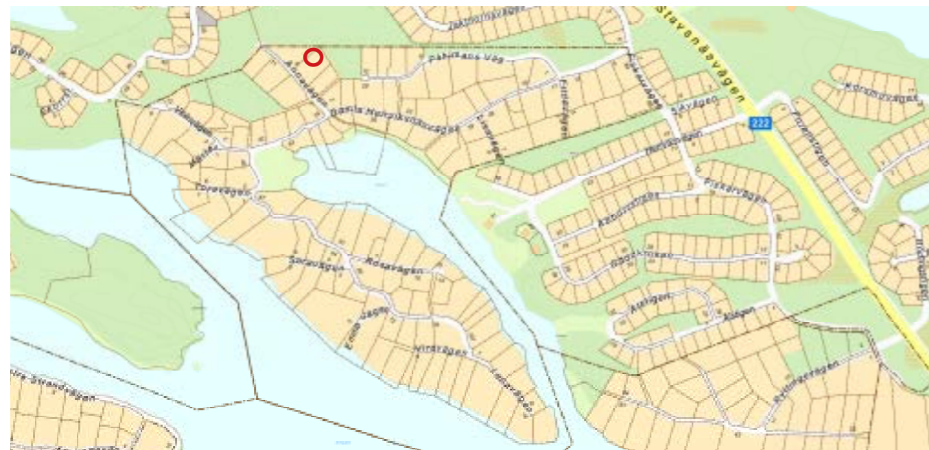
Figur 1. Ringen markerar ett instängt område inom planområdet för Herrviksnäs.

En ny detaljplan för Herrviksnäs innebär både för- och