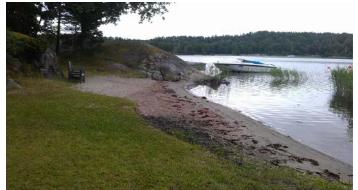
Badplats i Herrviksnäs

Planläggningen förväntas inte innebära någon försämring för det rörliga friluftslivet eller för växt- och djurlivet. Naturmarken närmast vattnet planläggs som allmän plats. Stora delar av de fastigheter som ligger längst vattnet på framförallt udden i Herrviksnäs består av enskilda fastigheter och är sannolikt inte möjligt att lägga ut som allmän plats utan stora kostnader för huvudmannen. De kommer därför läggas ut som kvartersmark med prickmarkering närmast vattnet som innebär att marken inte får bebyggas. På vissa fastigheter har möjligheterna för nybyggnation begränsats med prickmark på grund av markförhållanden med mycket brant terräng och/eller låglänta fuktiga områden.