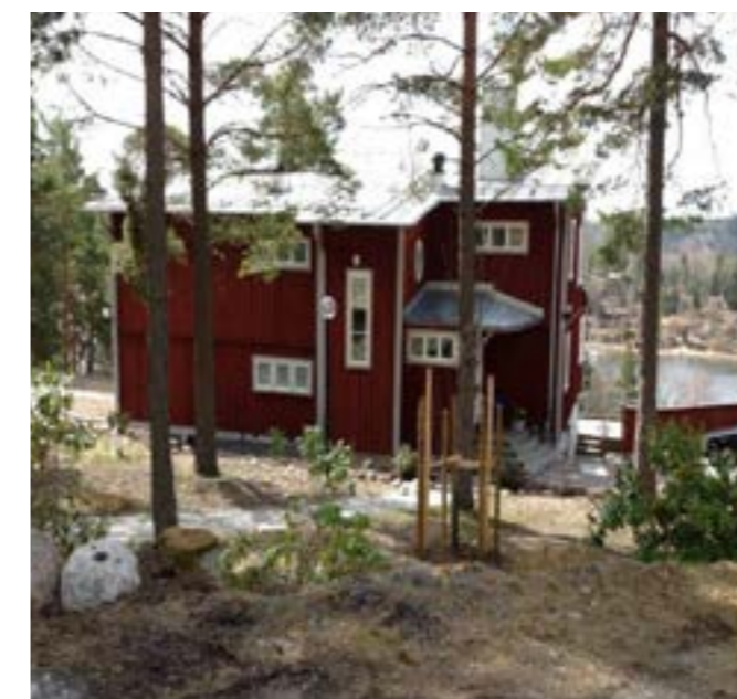
Bebyggelse i området

Planen medger att kommunala VS- ledningar kan byggas ut, vilket förväntas ge en förbättring av vattenkvaliteten inomplanområdet. Trafiken kommer troligtvis att öka med ökad andel permanentboende. Dock förväntas varken buller eller luftföroreningar öka nämnvärt. Planen medger vidare en ökad säkerhet i och med möjlighet till ökad vägbredd samt förbättrade värdmöjligheter. Utifrån planens förutsättningar bedöms det ej finnas någon påtaglig risk för att miljökvalitetsnormer för buller eller luftföroreningar överskrids.