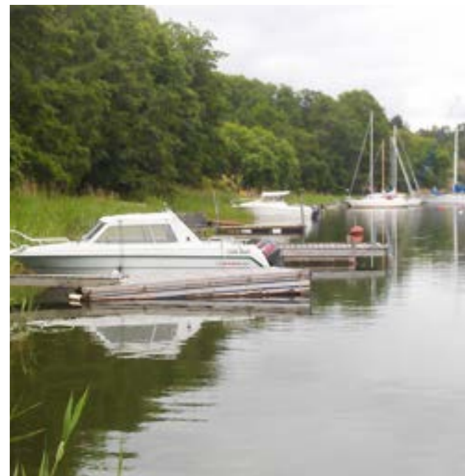
Befintligt bryggområde i Herrviken.

Enligt 2 kap. 1 § plan- och bygglagen (1987:10), förkortad ÄPBL, ska miljö kvalitetsnormer för luft- och vattenkvalitet samt omgivningsbuller iaktas vid planering och planläggning i enlighet med miljöbalkens 5 kap. 3 §. Vad gäller vatten finns det normer för både kemisk och ekologisk status.