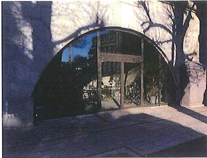
Norra valvet – inglasad serveringsyta