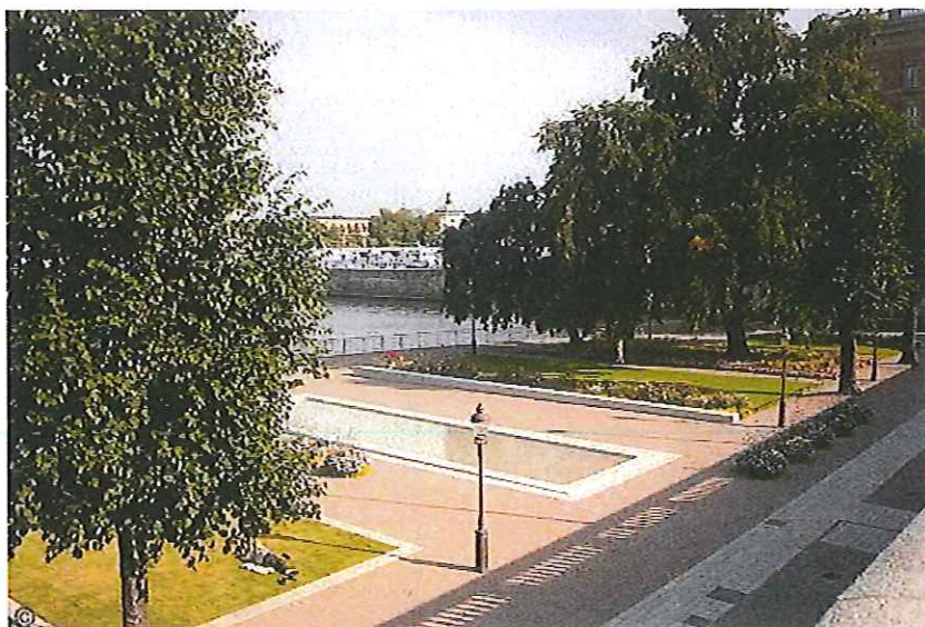
Vy över strömparterren från norra trapploppet

Befintliga smidesräcken runt kajen och i trapploppen har upprustats, kajräcket har försetts med grind för sänkhåvsfiskarna.