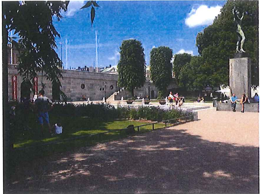
Parken med teknikbyggnad och café i bakgrunden