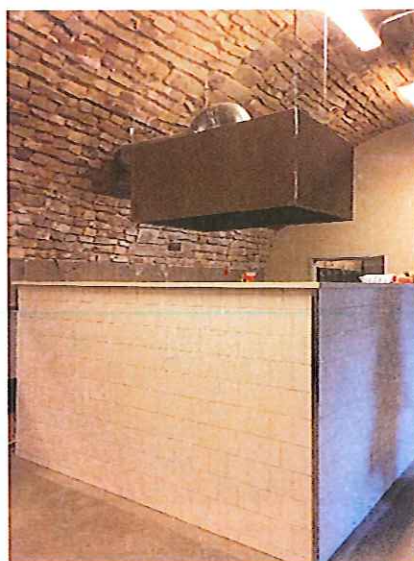
Diskutrymme i mellanvalv

Under brovalven som inglasats har utrymme för servering, disk, soprum och lager till cafébyggnad anordnats.