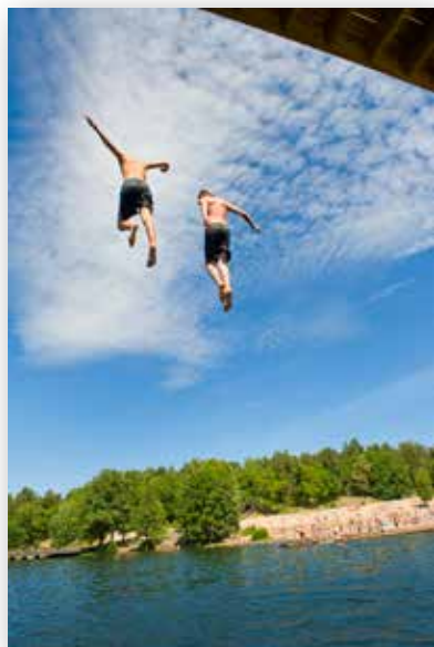
Flatenbadet - Skarpnäck