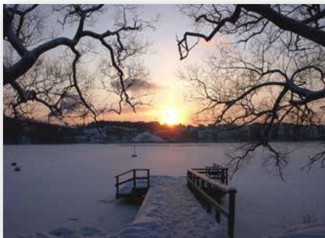
Årstaviken - Enskede-Årsta-Vantör

Skarpnäck Stadsdelsförvaltning Farsta stadsdelsförvaltning Enskede-Årsta-Vantör stadsdelsförvaltning www.stockholm.se