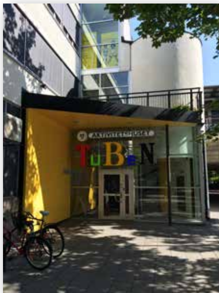
Aktivitetshuset Tuben - Farsta