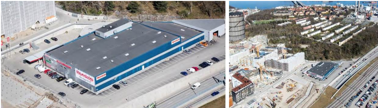
Bild: Ängsbotten 8 i Norra Djurgårdstaden