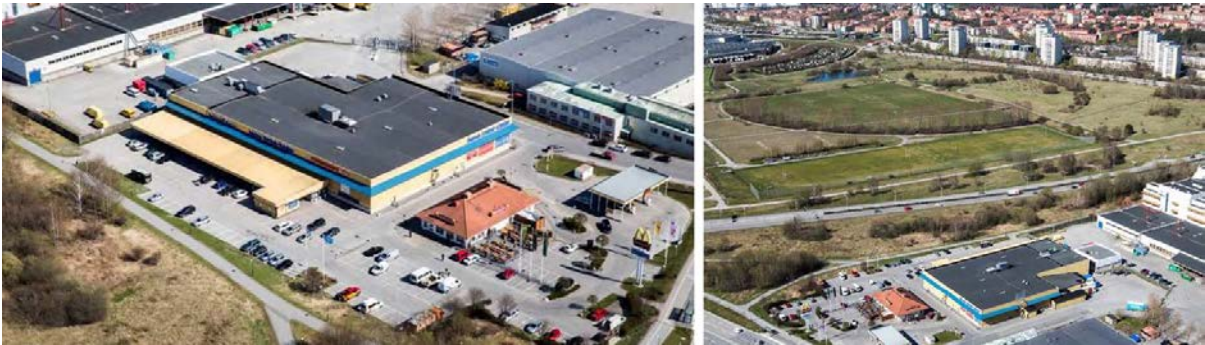
Bild: Vasslan 4 i Årsta