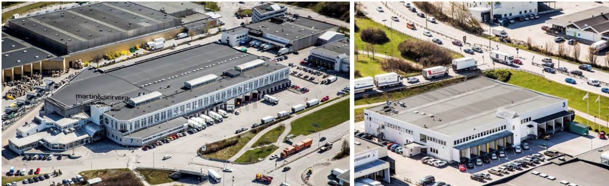
Bild: Postgården 2 och Postgården 4 i Årsta