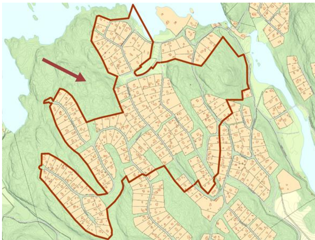
Planområdet för Raksta etapp 8.

Detaljplanen för Raksta, etapp 8, är en förnyelseplan med syfte att möjliggöra permanentboende i området. Planen medför att del av Raksta förses med kommunala VA-ledningar och förbättrad vägstandard. Vägarna och övriga allmänna platser inom planområdet får då även kommunalt huvudmannaskap. Byggrätter och tomtstorlekar föreslås i huvudsak följa de riktlinjer som anges i den fördjupade översiktsplanen för östra Tyresö från 2003. Planförslaget omfattar även skydd av värdefull kulturmiljö samt bevarande av värdefulla naturmiljöer.