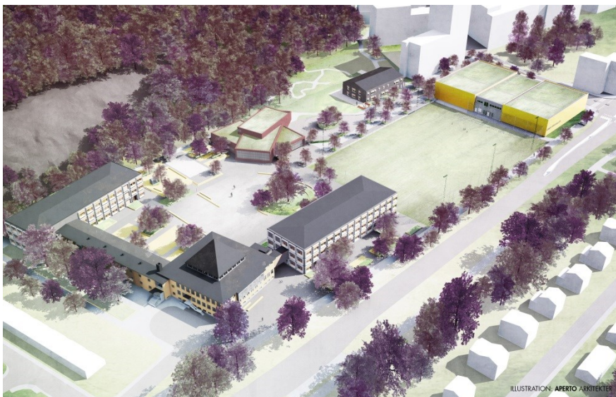
Visionsbild av den planerade skolan

Skolan är planerad att kunna inrymma 1 080 elever från förskoleklass till årskurs 9 och ett tillagningskök och matsal för 1 200 portioner per dag.