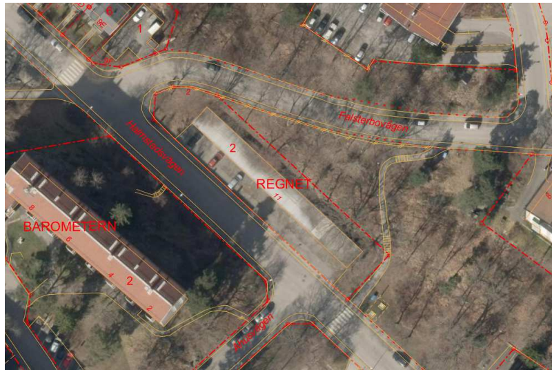
Ortofoto över fastigheten Regnet 2.