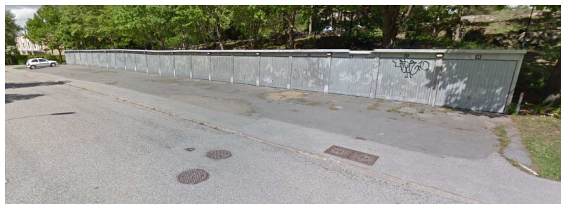
Gatuvy över garagelängan som finns på fastigheten Regnet 2.

Enligt 13 kap. 14 § JB får uppsägning ske endast om det är av vikt för ägaren att fastigheten används för bebyggelse av annan art eller annars på annat sätt än tidigare.