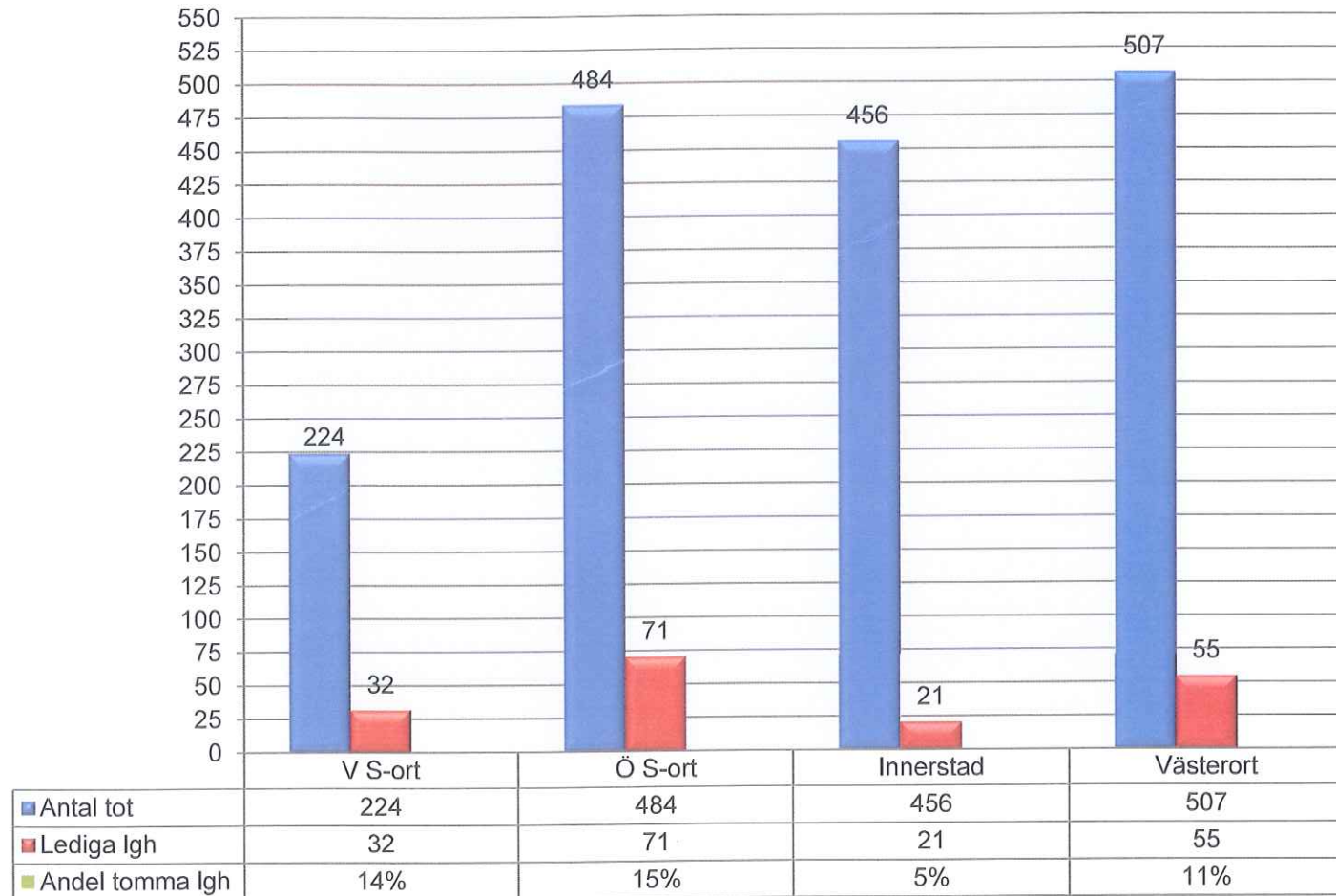
Servicehuslgh per område i staden