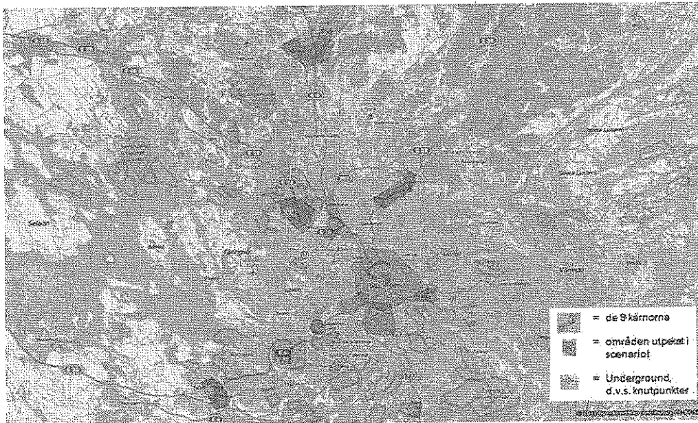
Bild 1: Följande kartbild visualiserar viktiga geografiska områden att ta hänsyn till vid placering av Af-enheter. Underliggande variabler utgörs av: Större Bytes-/knutpunkter (U), de nio kärnorna, inskrivna arbetslösa, förvärvsarbetande, nyetablering företag, nyanlända etablering, demografisk prognos per kommun, Ungdomar 18-24 år och var Försäkringskassans enheter med personliga handläggare är lokaliserade.

Anledningen till detta var att förslagen tog hänsyn till flera sammanvägda variabler 1 . Förslagen tog även större hänsyn till kundgruppen arbetsgivare samt utvecklingen i de framtida regionala kärnorna i Stockholm 2 . Slutsatserna illustreras även av nedanstående bild.