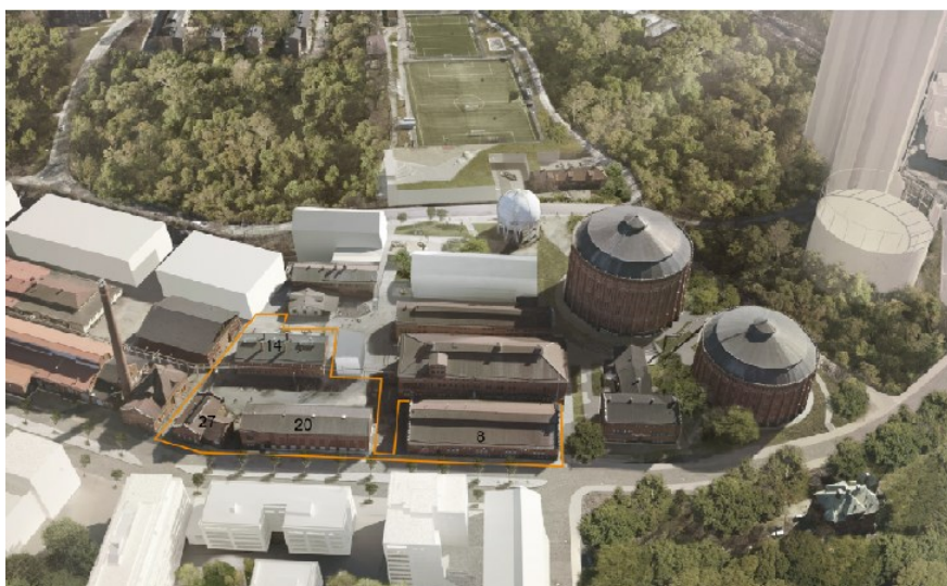
Montage med föreslagna volymer inom Gasverket västra samt planerade volymer i Gasverket östra. Planområde för Lilla Gasverket markerat med orange linje. (Flygfoto Stockholms stad, Montage: Arrhov Frick Arkitektkontor)