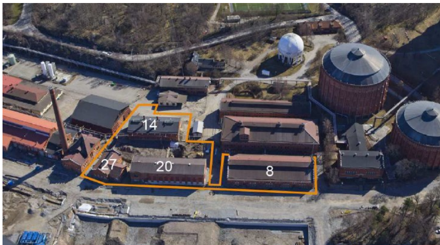
Planområdet markerad med orange linje samt byggnadernas numrering. Gasklockorna 1, 2 och 5 till höger, Hjorthagsberget i söder (norr är nedåt).

de kulturhistoriska värdena, både gällande befintliga byggnader och yttre miljö.