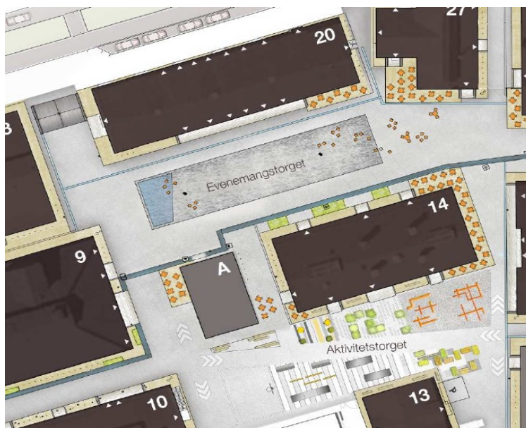
Illustrationsplan över Evenemangstorget och Aktivitetstorget (Sweco)

Aktivitetstorget är utformat för att både utgöra en resurs för hela stadsdelen och besökare i Gasverket samt att kunna användas av skolan. Torget är ca 1200 m 2 stort. Utformningen är tänkt som ett golv som möbleras för att bevara Gasverkets karaktär av öppen torgyta. På torget uppmuntras till fysisk aktivitet och det finns plats för exempelvis dans, parcour, basket, skate och odling.