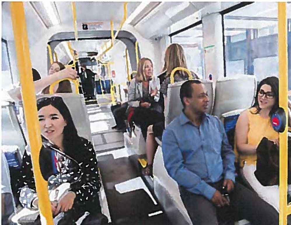
Korta restider är en förutsättning för att locka fler människor att resa med kollektivtrafiken.

SPÅRVÄG SYD GER KORTARE RESTIDER och gör det enkelt att byta mellan spårväg, buss, tunnelbana, pendeltåg och regionaltåg.