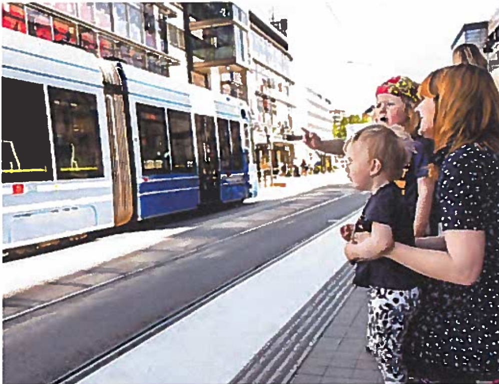
Spårväg syd ska underlätta pendling och erbjuda enkla och snabba byten.

AT PRESENT , there is a consultation process in progress regarding Spårväg syd, giving you an opportunity to say what you think! The County Council (landstinget) have planned open house days on 2 and 4 November. These will give you opportunities to receive information and express your opinions. If you wish, you can do so in English and Arabic. You can also send an e-mail to sparvagsyd@sll.se if you want information in either of those languages. Have your say on Spårväg syd!