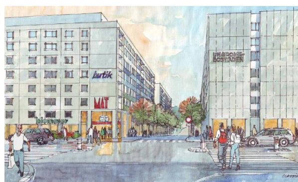
Korsningen Magnus Ladulåsgatan/Swedenborgsgatan efter ombyggnad