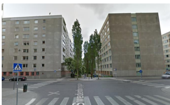
Korsningen Magnus Ladulåsgatan/Swedenborgsgatan idag

Nedan visas den tänkta ombyggnadens effekter på gatumiljön.