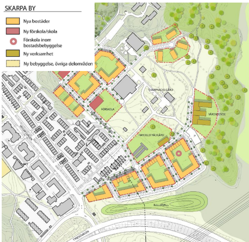
Bild 3. Förslag till bebyggelse i Skarpa by.

I södra delen av Skarpa by föreslås kvartersbebyggelse med vägar mellan. Området är utsatt för buller från Tyresövägen. Även här föreslår miljöförvaltningen en sammanhängande bebyggelse som bullerskärm längs vägen. Detta skulle förbättra ljudkvaliteten för boende i området, samt de rekreativa värdena norrut.