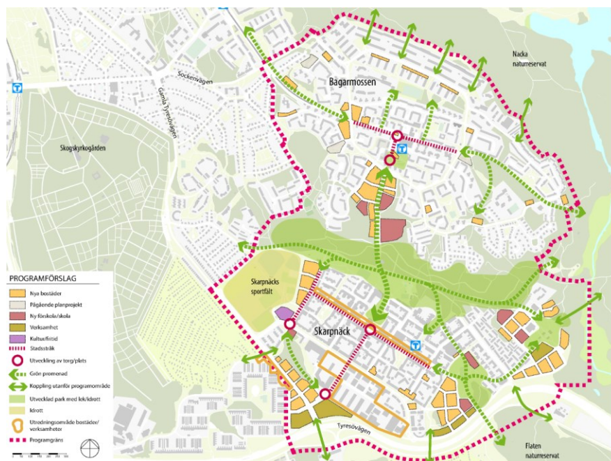
Bild 1. Programförslag.

Miljö- och hälsoskyddsämnden har fått förlängd svarstid för samrådet till den 17 december 2015.