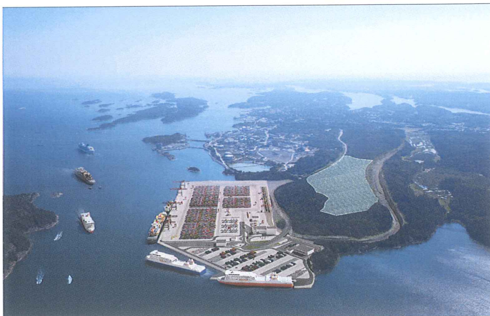
Figur 3. Illustration av hamnen

med att sammanställa allt material och kommer inom kort begära fastställelse av järnvägsplanen. Trafikverkets handläggning beräknas ta ca sex månader. Beslut om fastställelse kan överklagas till regeringen. När beslut om godkänd järnvägsplan vunnit laga kraft kommer ansökan om tillstånd till vattenverksamhet göras hos mark- och miljödomstolen beroende på att anläggandet av järnvägen i viss sträckning bl.a. kan påverka grundvattennivån. Åtgärderna bedöms inte ha betydande miljöpåverkan och tillståndprocessen beräknas till ca ett år.