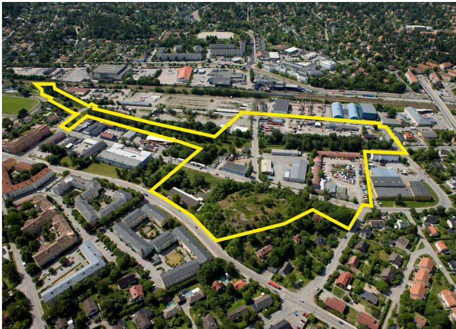
Flygfoto över planområdet

Området är beläget i nuvarande Bromstens industriområde i Spånga-Tensta stadsdelsområde, mellan 400 och 700 meter från Spånga station. Planområdet omfattar 8,7 hektar.