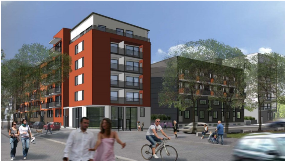
Möjlig vy över det södra kvarteret, sett från Skogängsvägen. (Illustration: Sweco Architects)

Södra kvarteret föreslås innehålla 147 lägenheter, 249 cykelparkeringsplatser och 97 bilparkeringsplatser. Detta innebär parkeringstal för cykel om 2,18 och parkeringstal för bil om 0,66.