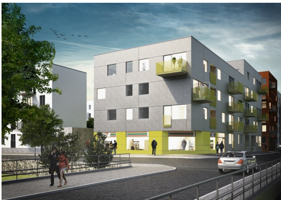
Möjligt perspektiv från bron över Spånga-ån. (Illustration: Arkitekthuset)

Byggnadernas våningsantal varierar från fyra till sex och som helhet trappas kvarteret ned från fornborgen i norr till Spångaån i söder, där det är som lägst. Den smala kvartersgatan från Norra kvarteret fortsätter mellan det Östra kvarterets två delar till Stora parken. Kvarterets delar är ordnade runt gemensamma, halvt upphöjda gårdar. Under gårdarna finns ett sammanlänkat parkeringsgarage med ca 90 parkeringsplatser samt lägenhetsförråd. Garaget nås från Winqvists väg. På kvartersgatan finns 10 p-platser inkl. reservation för bilpoolparkering.