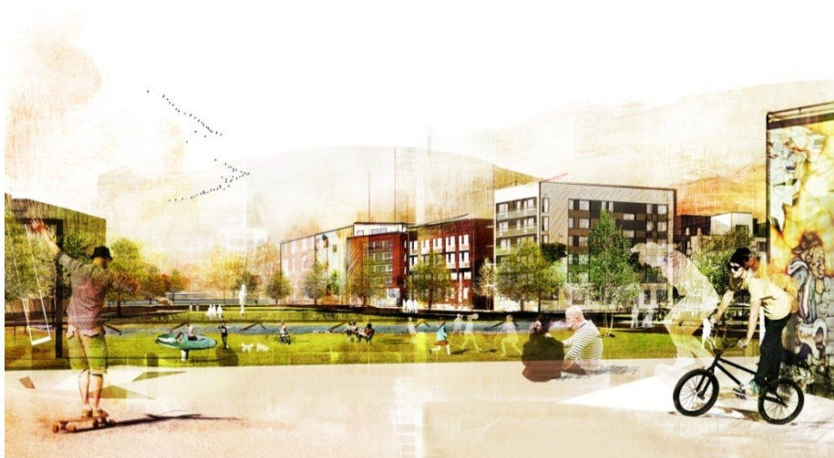
Möjlig vy över Stora parken med Spångaån från nordost. (Illustration: White Arkitekter)

Mitt i den nya stadsdelen formas ett centralt parkrum som öppnar sig mot Spångaån och länkar samman de två sidorna. Parkens gräsytor lutas mot ån och kommer därför delvis att översvämmas vid högvattnen, vilket präglar strandvegetationens artsammansättning. Parallellt med norra åkanten läggs en bro över den långgrundna strandkanten. För att förstärka parken som offentligt rum ramas den in av trädrader utmed omgivande gator. De inramande trädraderna hjälper till att leda blicken och förstärker kopplingen mellan järnvägen och parkens norra aktivitetsdel. I Stora parkens norra del utmed Winquists väg rivs nuvarande industribyggnad, men dess graffitimålade gavelvägg sparas och integreras i en lättare lekstruktur. I denna solexponerade del av parken föreslås en lekplats. Lekplatsen organiseras i avdelningar med olika innehåll som ska fungera för alla åldrar, från småbarn till ungdomar. Lekutrustningen är utvald för att vara lockande, hållbar och attraktiv.