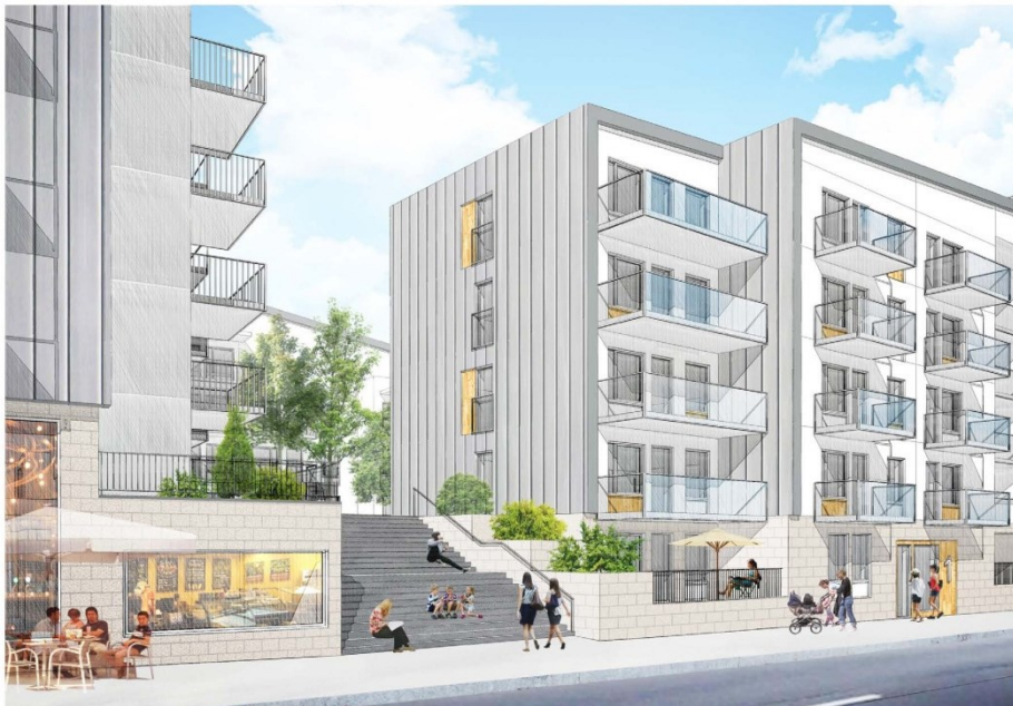
Möjlig vy över det norra kvarteret från söder. (Illustration: ÅWL arkitekter)

Norra kvarteret föreslås innehålla 178 lägenheter, 357 cykelparkeringsplatser, 108 bilparkeringsplatser i garage samt fem platser på kvartersgatan som kan nyttjas för bilpool. Detta innebär parkeringstal för cykel om 2,0 och parkeringstal för bil om 0,61.