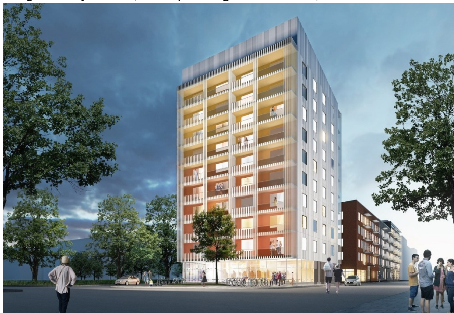
Västra kvarteret sett från väster. (Illustration: Rippelino arkitekter)

Västra kvarteret föreslås innehålla 136 lägenheter, 311 cykelparkeringsplatser, 47 bilparkeringsplatser och tre platser som kan nyttjas för bilpool. Detta innebär parkeringstal för cykel om 2,29 och parkeringstal för bil om 0,34.