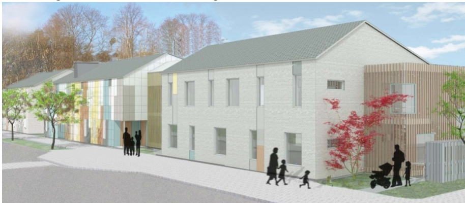
Möjligt perspektiv över förskolan (Illustration: TM Konsult och sbk)

Mellan Duvbovägen, fornborgen och Stora parken utökas nuvarande förskoletomt med en ny förskolebyggnad i åtta avdelningar vid Winquists väg. Den långsträckta byggnaden blir en fond i parken. I kontrast till stadsdelens slutna bostadskvarter får förskolan karaktär av en fristående paviljong. Genom den låga skalan, två våningar, tillåts fornborgen behålla sin dominerande position.