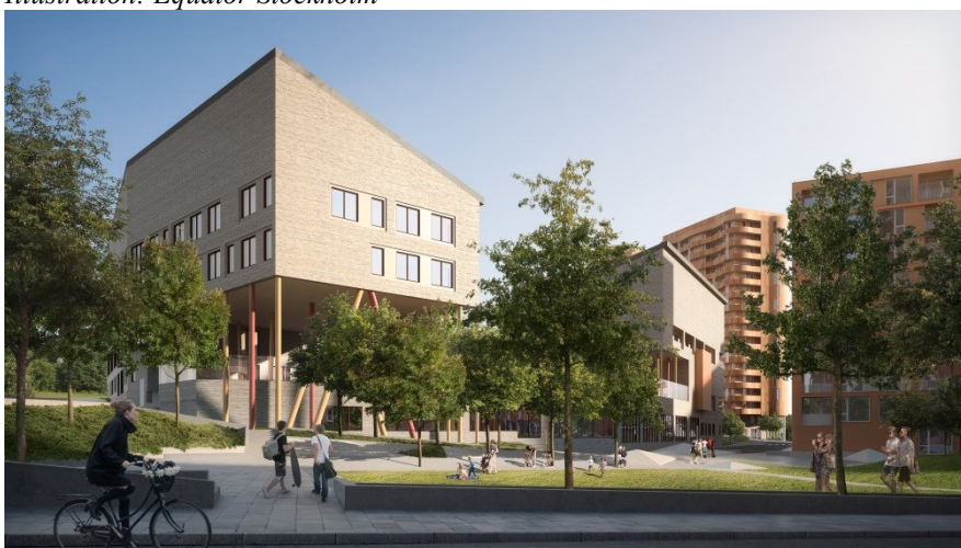
Illustration: Equator Stockholm

Skolan. Vy från den anlagda parken sett mot skolan.