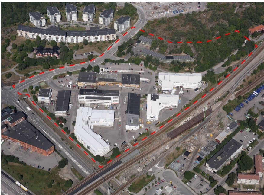
Planområdet inom streckad linje. Flygfoto från söder.