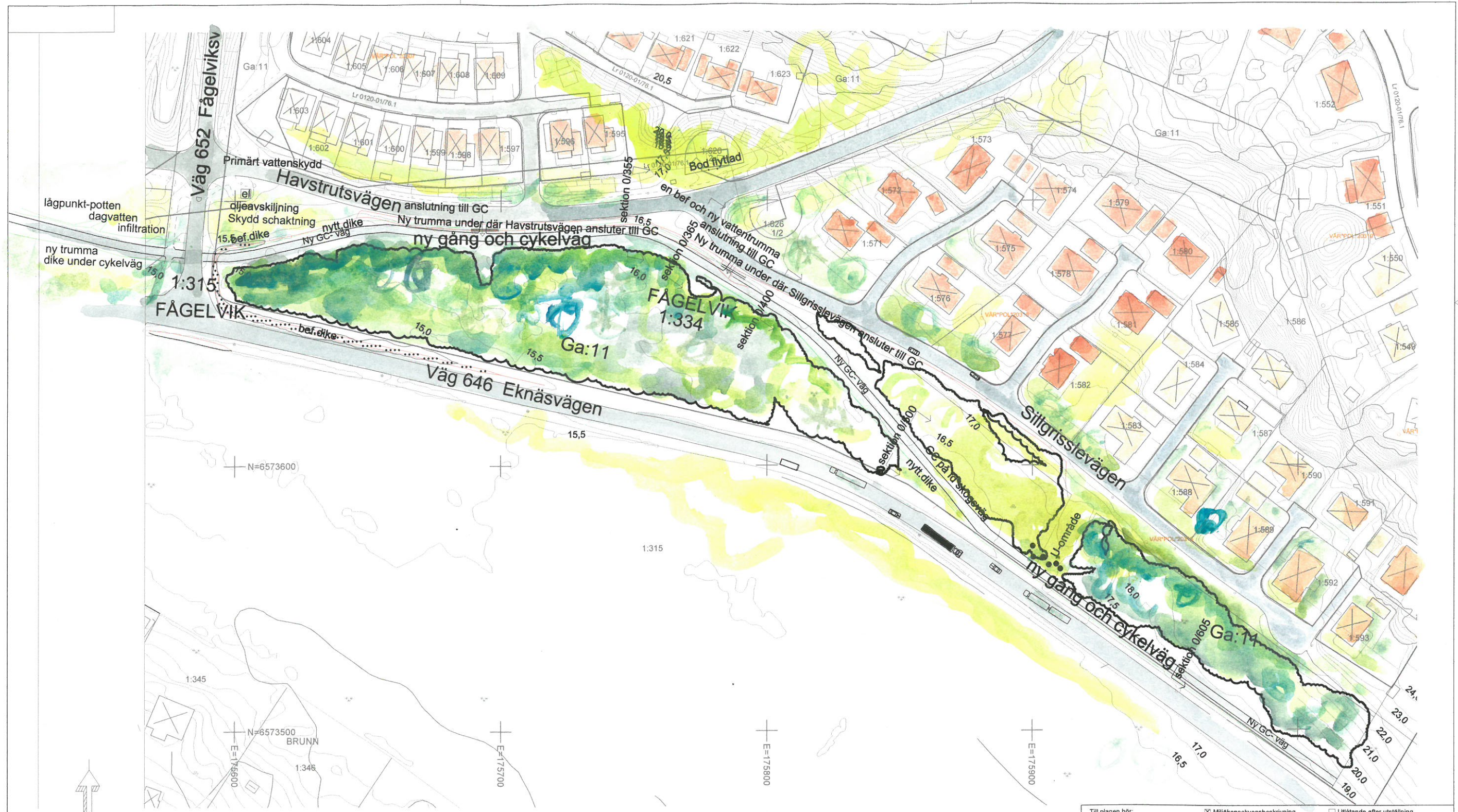
Illustrationskarta Skala 1:1000 i A2-format Skala 1:2000 i A4 format