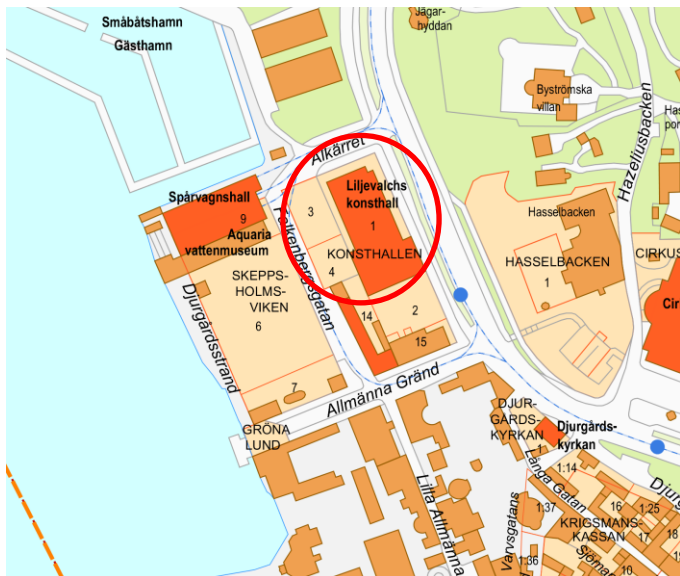
Fastigheterna Konsthallen 1, 3 och 4.