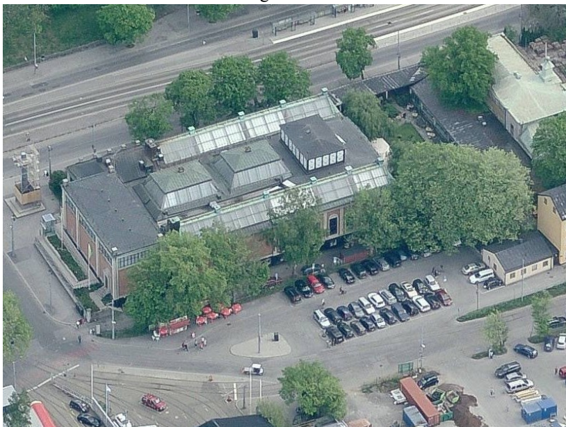
Konsthallen, restaurang Blå Porten och parkeringsplatserna mot Falkenbergsgatan..

Liljevalchs konsthall anses vara en av Stockholms vackraste byggnader och är en välrenommerad och internationellt känd utställningsmiljö för konst. Byggnaden ritades av arkitekt Carl Bergsten och är blåklassad, det vill säga, har högsta bevarandeklass i Stadsmuseets klassificeringslista. Konsthallen ägs av Stockholms stad och invigdes 1916 med syfte att göra konst mer tillgänglig för alla som den första självständiga och offentliga konsthallen för samtida konst i Sverige. Liljevalchs konsthall förvaltas sedan årsskiftet 2010/2011 av fastighetsnämnden.