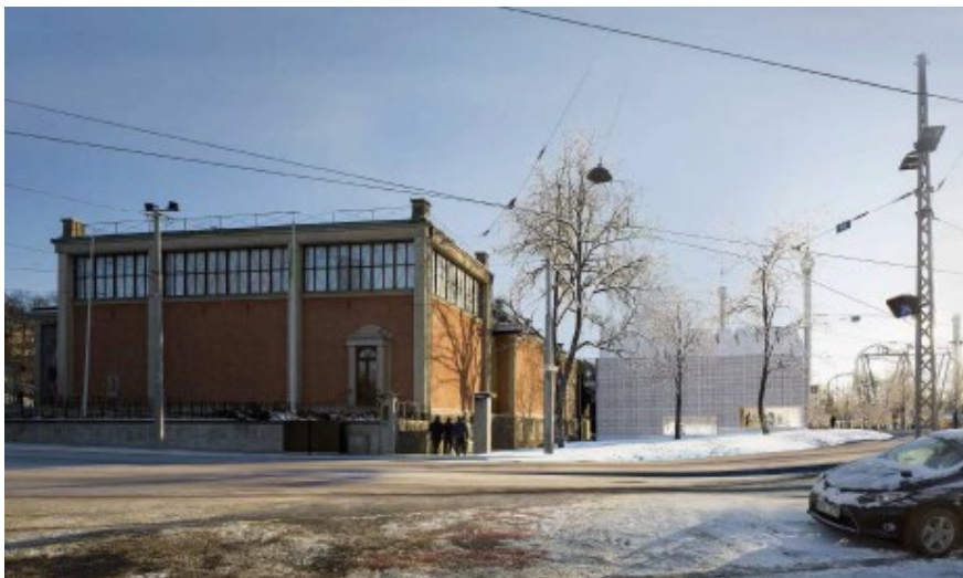
Utbyggnadsförslag "Liten" av Gert Wingårdh och Ingegerd Råman

möjligheter att hantera ett gynnsamt inomhusklimat och erbjuda bra och säkra inlastningsmöjligheter.