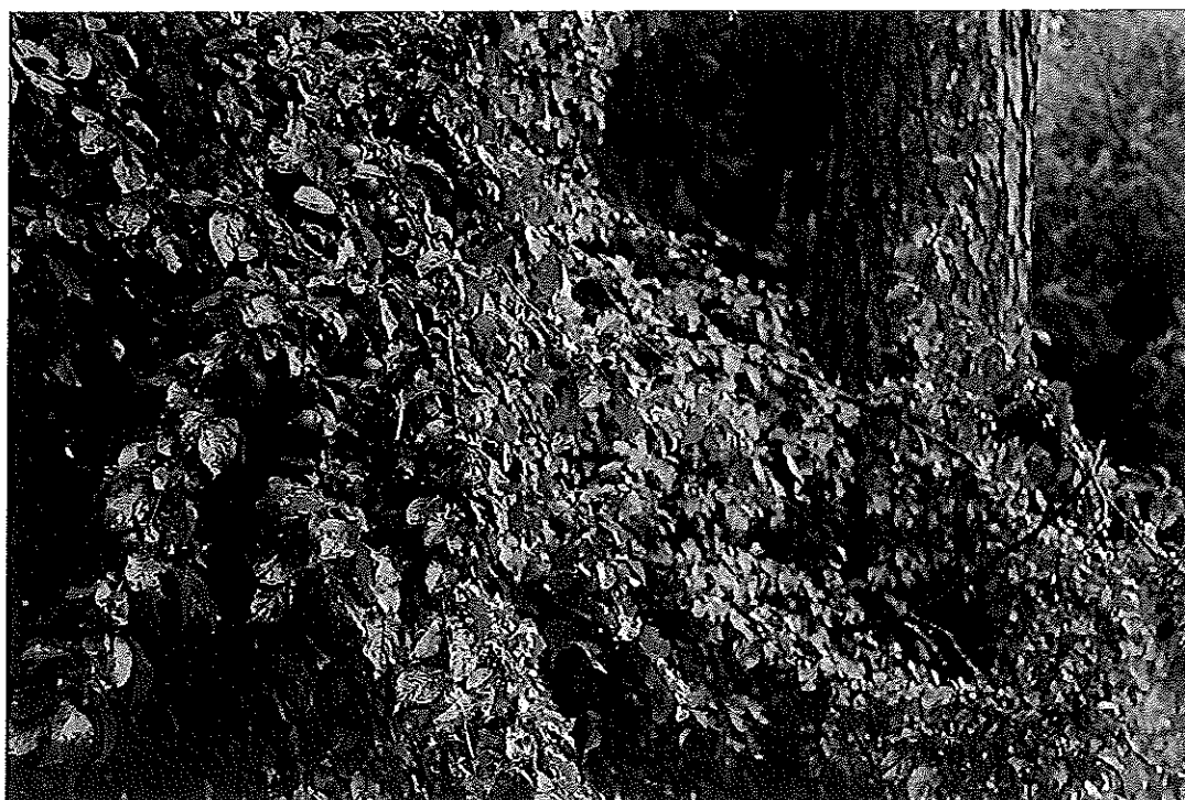
Bilderna ovan: Aroniabär, Hauptvägen, Mirabeller, Russinvägen. Bilderna nedan: Grannar plockar körsbär, Tobaksvägen, Hökarängens Frukt & bärkarta.