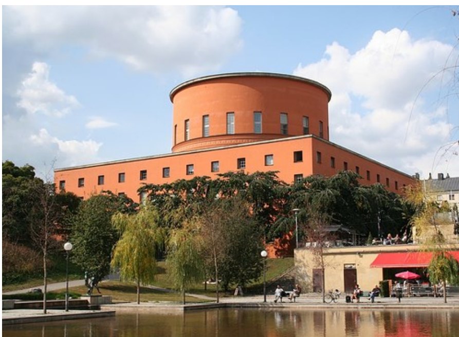
Stadsbibliotekets huvudbyggnad Asplundshuset

Fastighetskontorets och kulturförvaltningens gemensamma tjänsteutlåtande daterat den 28 september 2015 har i huvudsak följande lydelse.