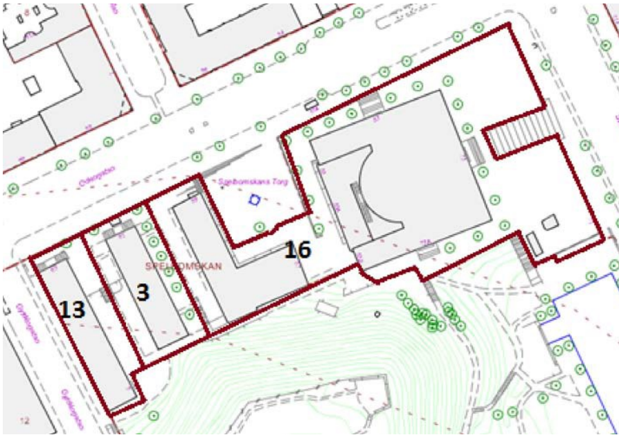
Kvarteret Spelbomskan 3, 13 och 16