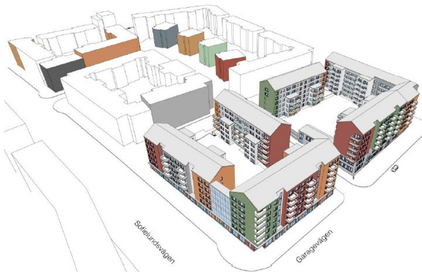
Figur 2: Perspektiv mot nordväst

framförallt mot de två större gatorna Sofielundsvägen och Garagevägen. Totalt tillkommer lokaler fördelat på cirka 950 kvm skola/kontor och cirka 450 kvm handel.