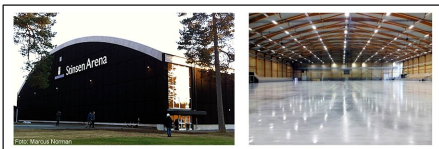
2 Referensanläggning Stinsen arena.