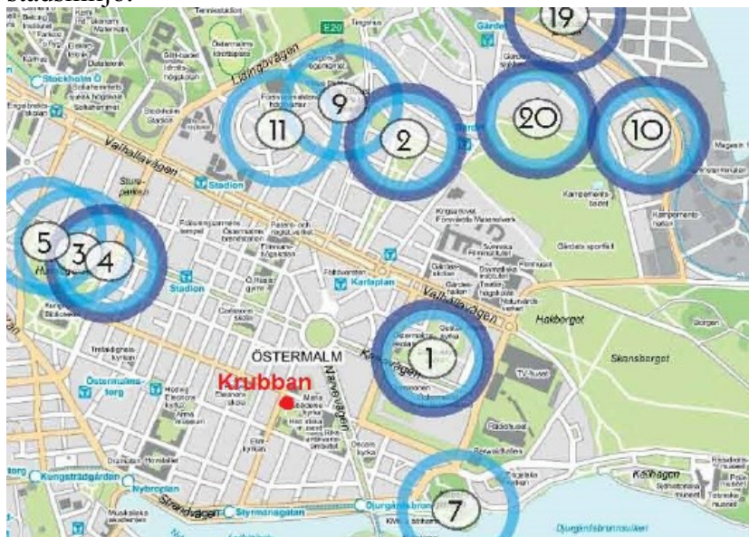
Bilden visar placering av befintliga lekplatser med en markerad avståndsradi om 200m

Förvaltningen ser gärna ett samarbete med Statens Fastighetsverk om att utveckla utemiljön i kvarteret Krubban för en levande stadsmiljö.