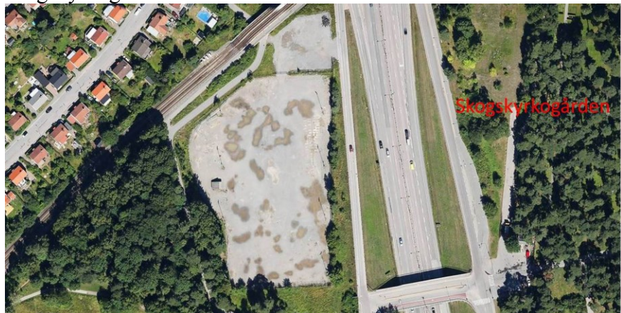
Satellitbild från eniro: Tallkrogens bollplan med omgivning

Tallkrogens bollplan utgörs av en grusyta med ungefärliga mått 130 m x 65 m. Den begränsas i söder och väster av cykel-/gångstråk och talldunge, i norr av cykel-/gångstråk och tunnelbana, och i öster av slänten upp mot Lingvägen, som på platsen utgörs av en enkelriktad ramp upp från Nynäsvägen. På andra sidan Nynäsvägen ligger skogskyrkogården.