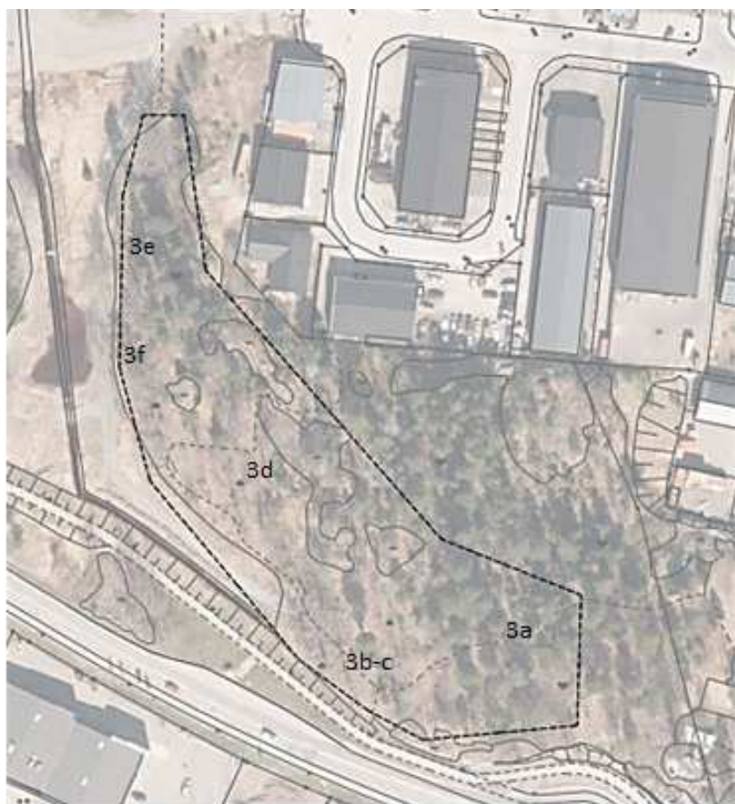
Karta – skötselåtgärder – Mölnvik