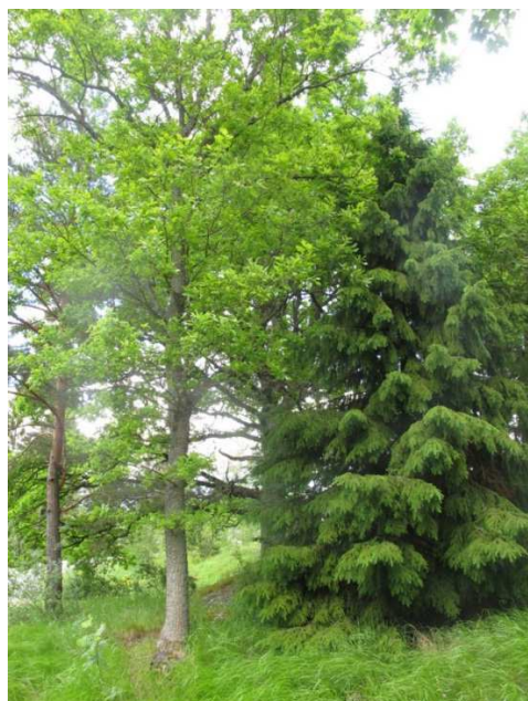
I norra delen är flera ekar hotade av uppväxande granar, vilka bör tas bort.