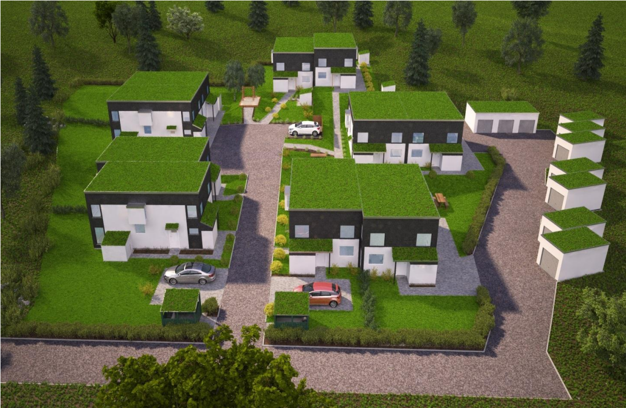
Volymstudie av de nya parhusen, sett från öster.