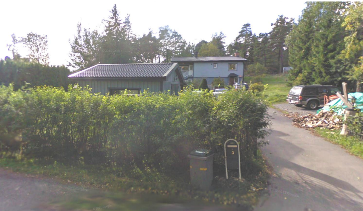
Fastigheten Kumla 3:242, Malmstigen 3

På Kumla 3:245 står ett friliggande bostadshus i en våning med inredd vind och sammanbyggt garage om totalt ca 280 kvm. Huset är ursprungligen en sommarstuga från 1930-talet men ombyggt till permanentbostad i omgångar och klätt i vit, liggande träpanel.