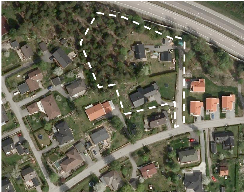
Flygfoto som visar storleken på omgivande bebyggelse (planområdet markerat)

Den föreslagna bebyggelsen bedöms kunna samspela med omkringliggande småhusbebyggelse i både volym och uttryck. Bebyggelsen ska utformas med omsorg om arkitektur, material och välplanerad utemiljö, i enlighet med kvalitetsprogrammet.