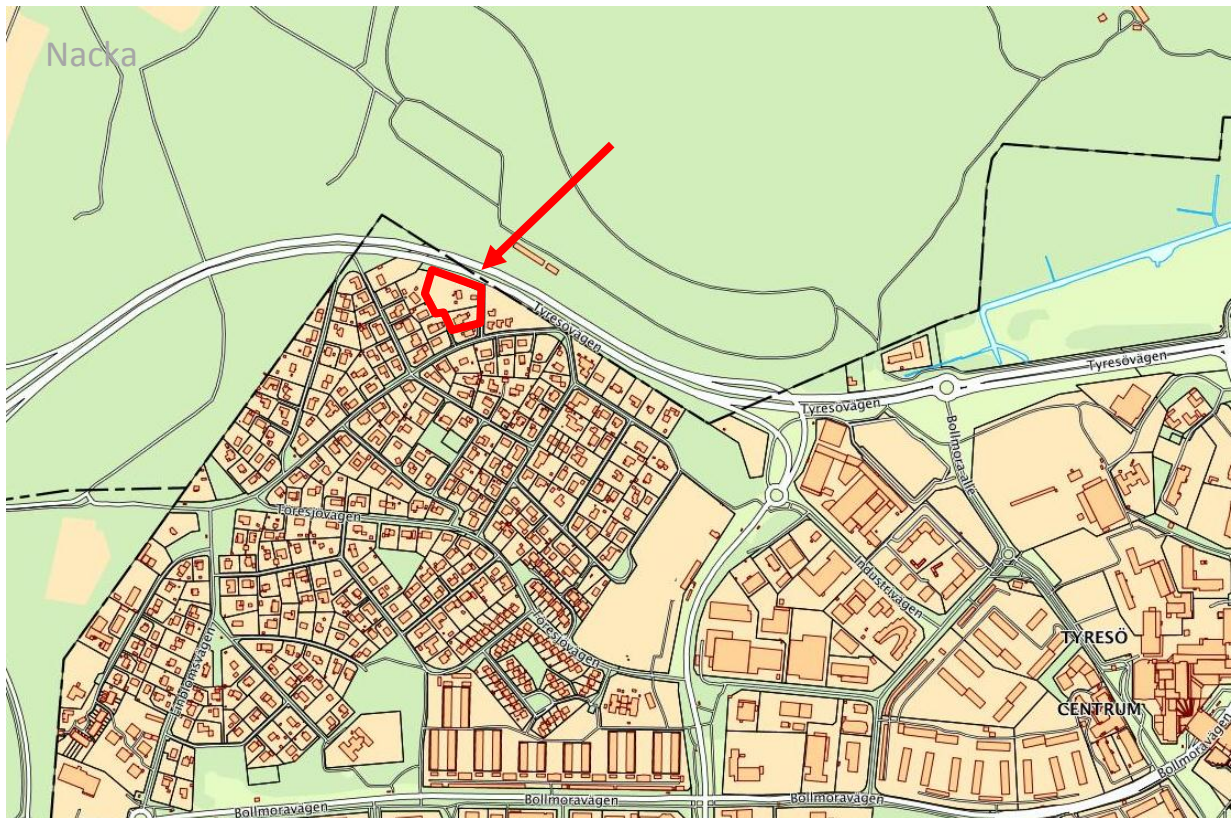
Planområdets läge nordväst om Tyresö centrum

Malmstigen 1 & 3, Tyresö kommun, Stockholms län