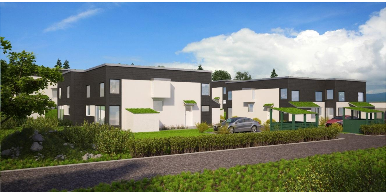
Perspektivbild som visar exempel på utformning av parhusen sett från Malmstigen. Arkitekt Stig Jarefeldt. Illustration: ALB Mäklarplan.