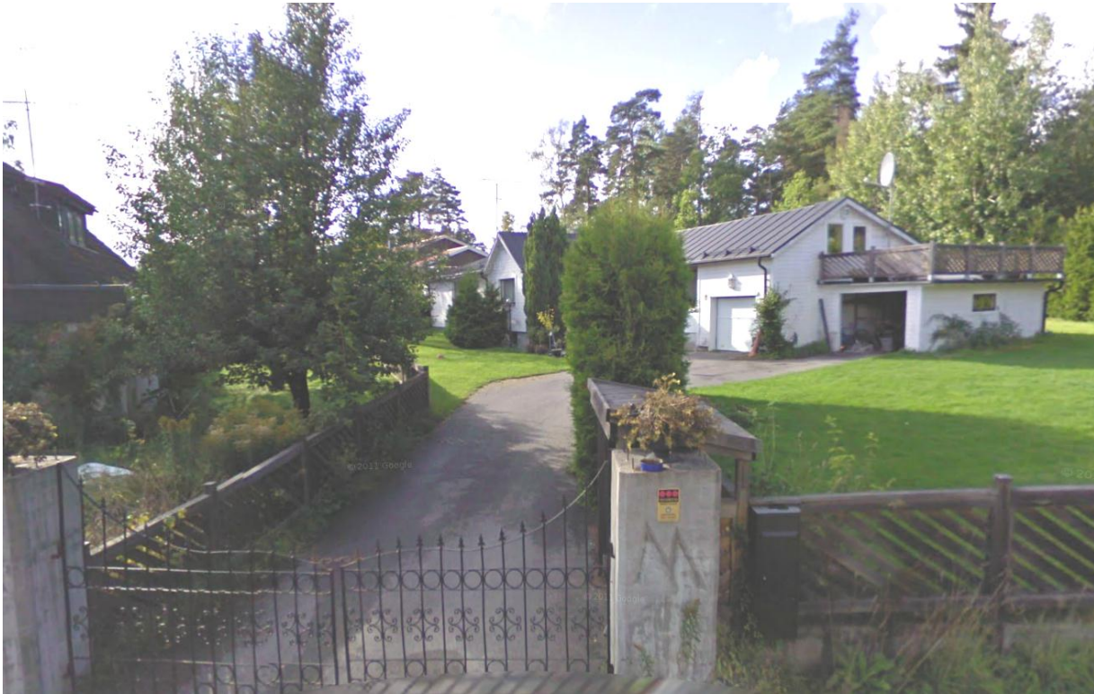
Fastigheten Kumla 3:245, Malmstigen 1