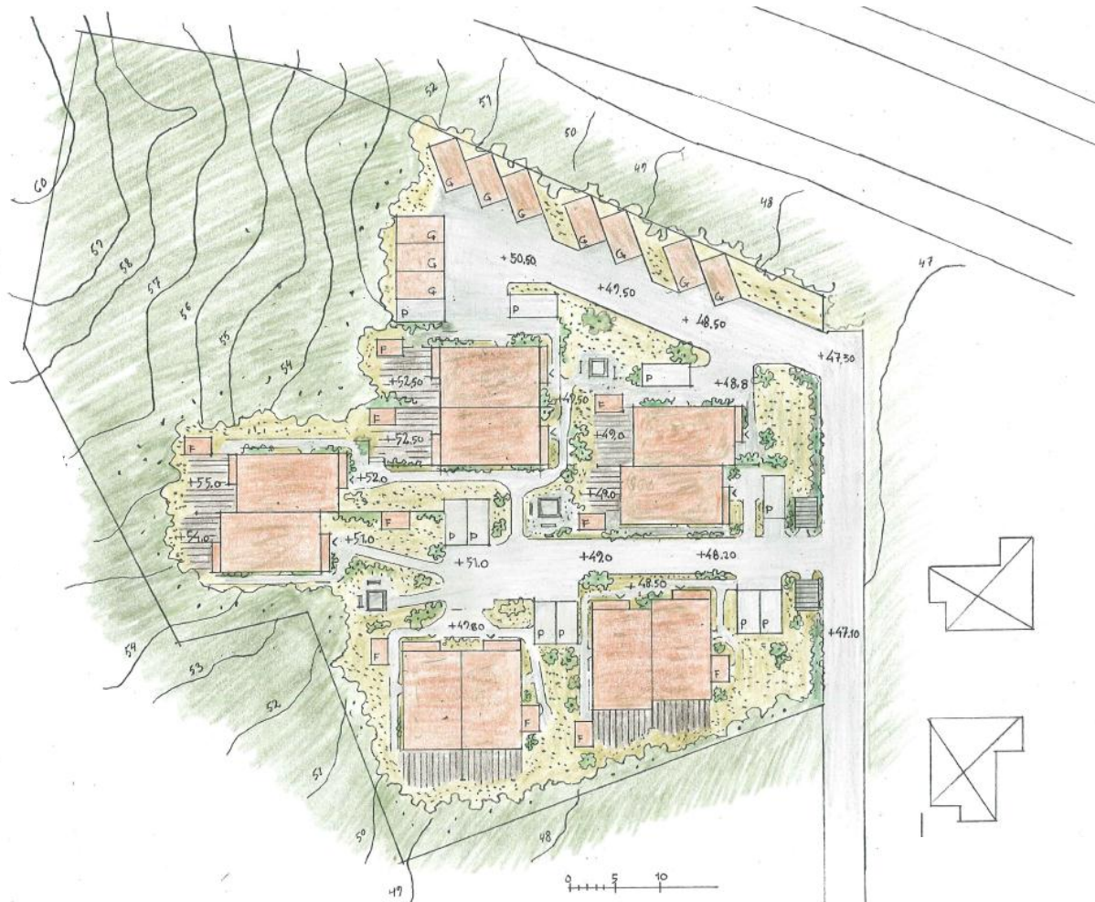
Illustrationsplan över planområdet omfattande fem nya parhus med tillhörande garage, parkering och uteplats samt två gemensamma sophus inom fastigheten Bollmora 1:12. Illustration arkitekt Stig Jarefeldt.