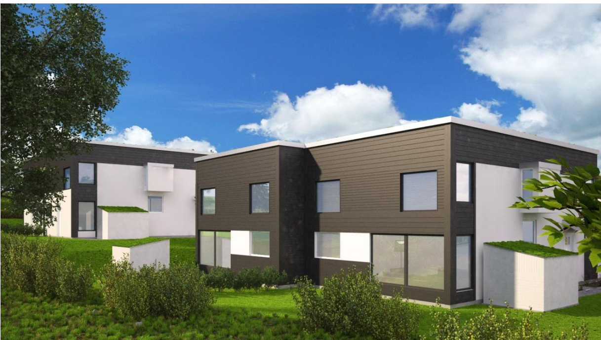
Parhusens fasader mot söder.