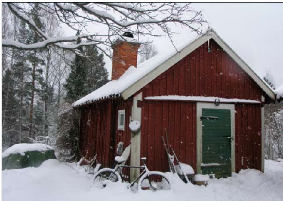
Stuga 2 från norr.