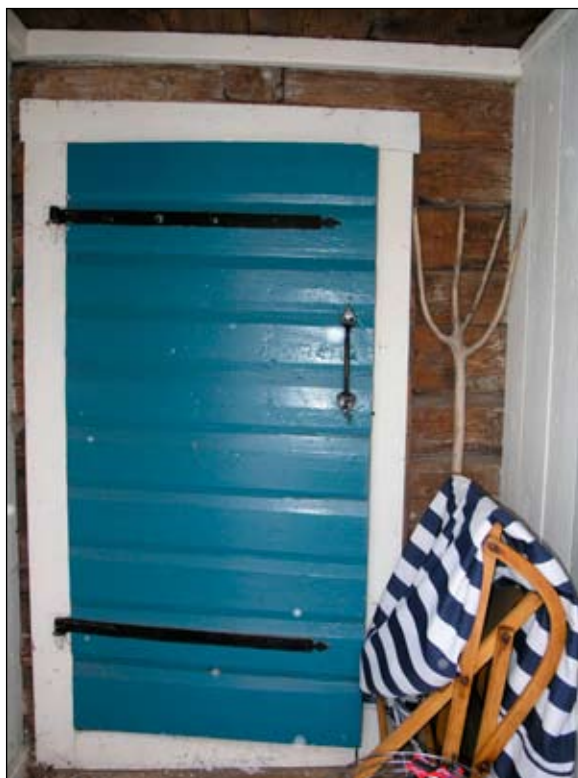
En äldre ytterdörr sitter kvar i farstun.

Byggnaden är timrad med rödfärgade locklistpanelade fasader med vitmålade inklädda knutlådor, fönster och vindskivor. Taket är ett åstak och täcks med enkugigt äldre lertegel. Den höga skorstenen är oputsad och har ett profilerat krön. Tre fönster av olika utformning; ett tvåluftsfönster med två rutor/båge och pressade beslag vanliga under tidigt 1900-tal i södra gaveln, ett enluftsfönster med fyra rutor och pressade beslag i västra fasaden och ett litet ospröjsat enluftsfönster i östra fasaden.