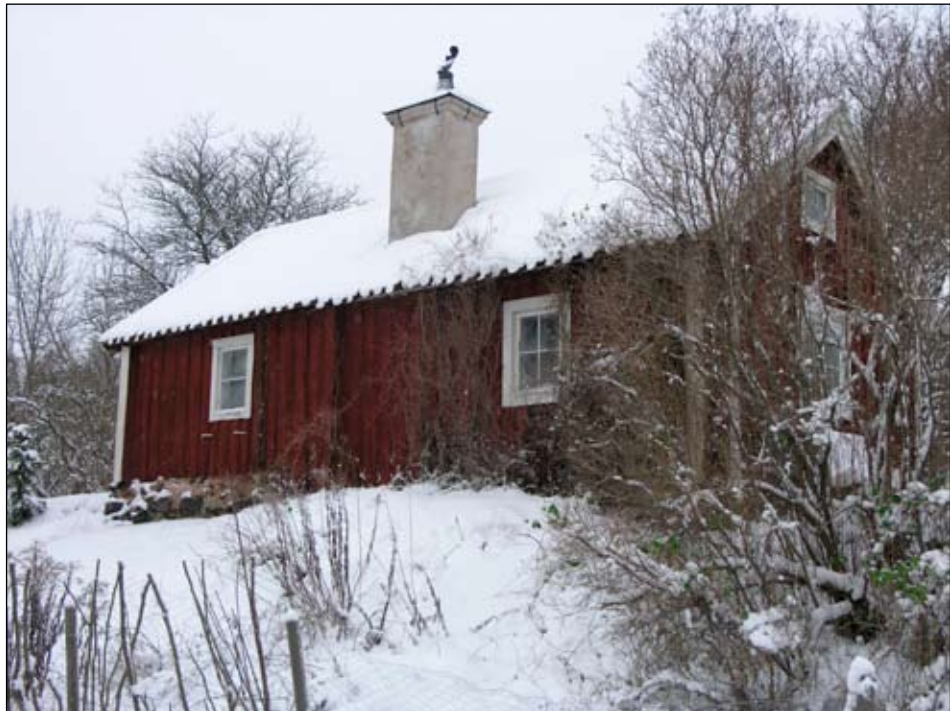
Stuga 1 från väster.

Den äldsta stugan på tomten utgörs av en timrad tvårumsstuga med tillbyggd farstuvist i en våning. Byggnaden är ursprungligen en enrumsstuga med okänt byggnadsår, tillbyggd med ett rum troligen under tidigt 1700-tal. Enligt uppgift finns en igensatt dörr i byggnadens norra del åt öster.