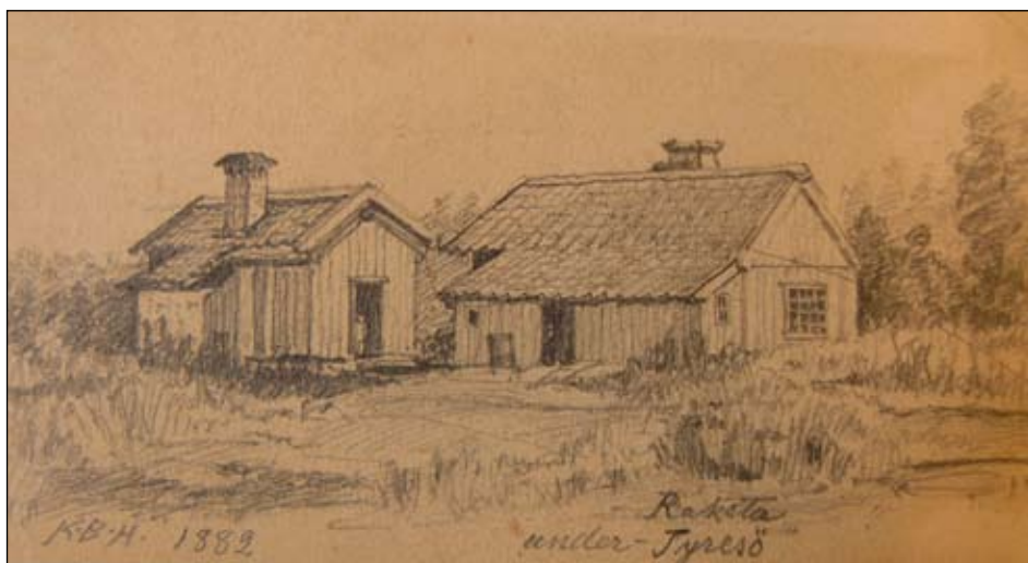
Lilla Raksta, K. B. Hellström, 1882. Avfotograferad teckning.

Lilla Raksta bedöms sammantaget omfattas av ett särskilt kulturhistoriskt värde och bör därför skyddas i detaljplan. För byggnaderna Stuga 1 och 2 samt uthus kan beteckningen q användas och kompletteras med index för rivningsförbud