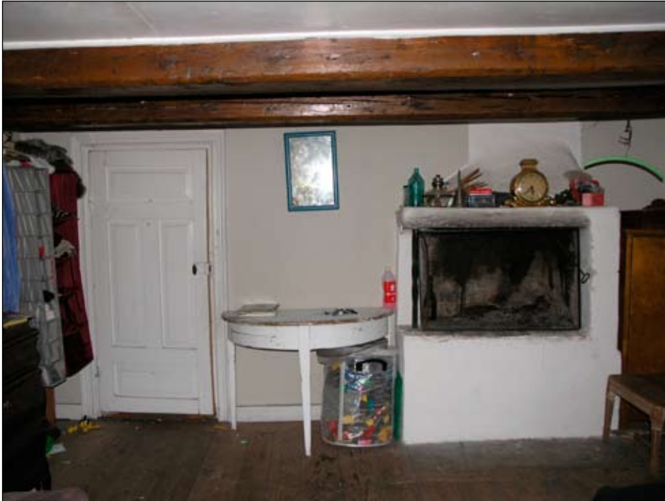
Kammaren med skurgoh, synliga takbjälkar och öppen spis.

Profilerade dörr- och fönsterfoder. Fönsterna är okopplade och försedda med uppställningsbeslag av 1800-talsmodell.