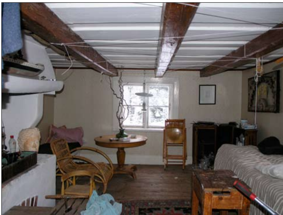
Interiör i stuga 2.

I fastun sitter den äldre ytterdörren kvar utgjord av en bräddörr med fasspontpanelade liggande bräder försedd med smidda bandgångjärn. Byggnadens entrédörr är en bräddörr klädd med smala, liggande brädor och är försedd med bandgångjärn.