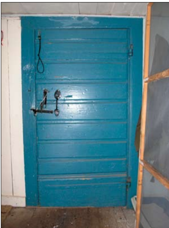
Den tidigare ytterdörren sitter kvar i förstukvisten. Bräddörr klädd med liggande profilerad panel försedd med kraftiga bandgångjärn och äldre smidesdetaljer.

och låsbeslag. Farstukvisten är försedd med en hängränna av trä.