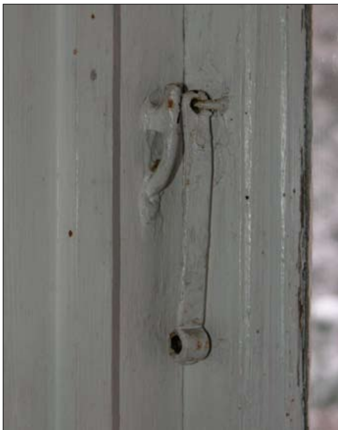
Uppställningsbeslag av 1800-talstyp.

Enrumstuga med tillbyggd fastu. Öppen spis med igenmurad bakugn. Stugan har äldre breda skurgolv spikade med handsmidd spik. Taket utgörs av bred lockpanel mellan takbjälkar. Hög golvlister med fasad profil. Tapetserade väggar. Fönsterna utgörs av okopplade, enkla bågar försedda med uppställningsbeslag av 1800-talsmodell.