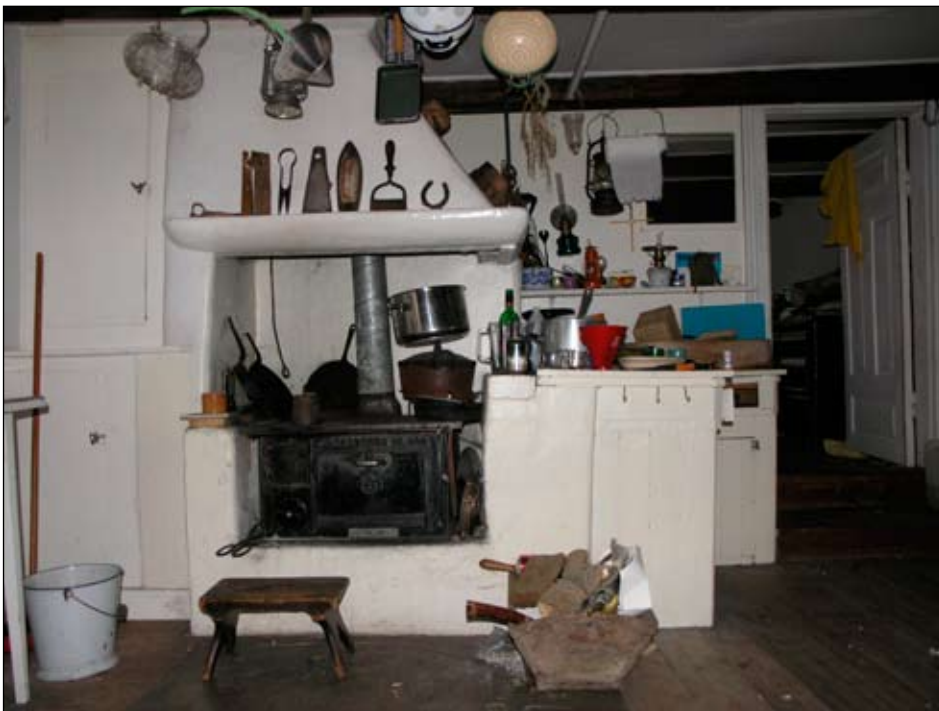
Köket med kökspis med kåpa och fasta skåp.

Profilerade dörr- och fönsterfoder. Fönsterna är okopplade och försedda med uppställningsbeslag av 1800-talsmodell.