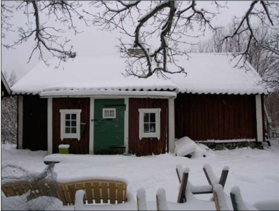
Stuga 1 från öster.

Stugan står på en fogad naturstensgrund och är timrad med panelade fasader med delvis okantad locklistpanel. Fasaderna är rödfärgade med vita inklädda knutar. Taket är ett åstak täckt med enkupigt äldre taktegel. Under takteget ligger ett äldre brädtak kvar.