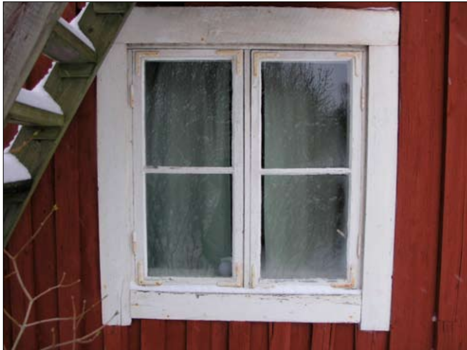
Okopplade tvåluftsfönster i gavlarna med pressade hörnjärn vanliga under 1900-talets början.