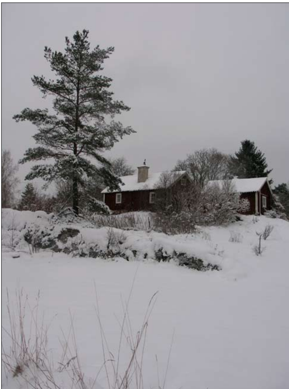
TVå av stugorna (Stuga 1 och 2) på Lilla Raksta ligger på en höjd omgiven av en stor naturtomt i området Raksta.

Lilla Raksta ligger vid Rakstaringen i Raksta. Bebyggelsen ligger på en höjd omgiven av en stor naturtomt.