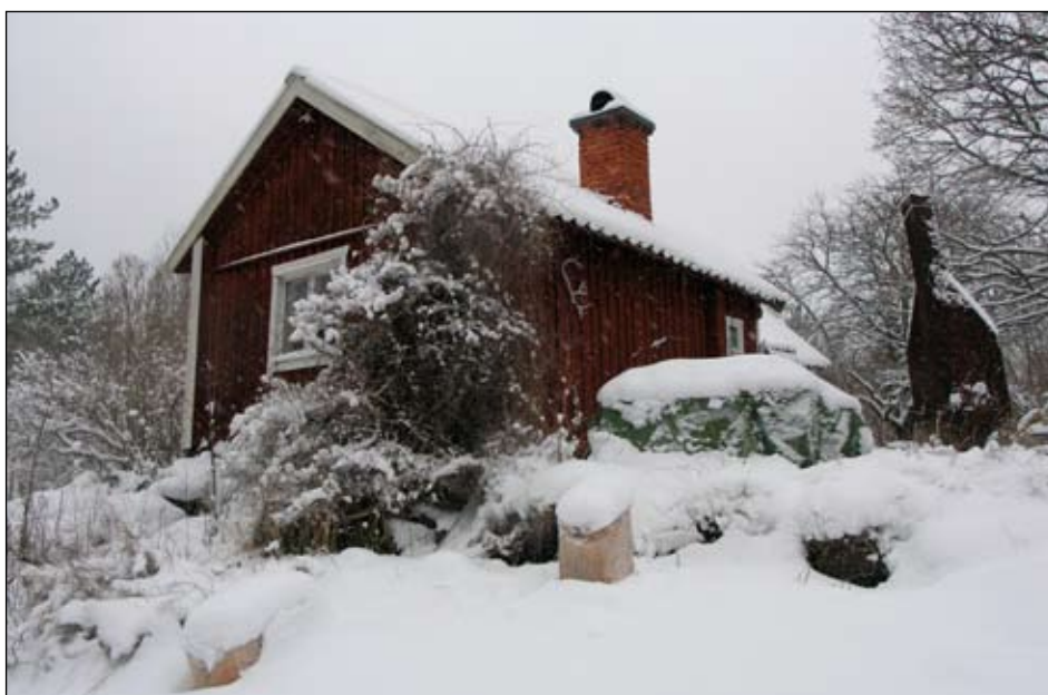
Stuga 2 från sydöst.

Enrumstuga med ingång i gaveln. Enligt uppgift från ägaren möjligen uppförd under 1800-talet och farstun tillbyggd 1937.