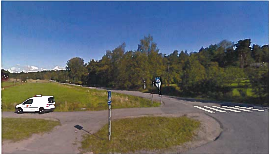
Dalgången vid Tjärnstigen sedd från Tyresövägen mot norr.

sambanden riskeras att byggas för. Fastigheten är därför inte heller lämplig att styckas i öst-västlig riktning.