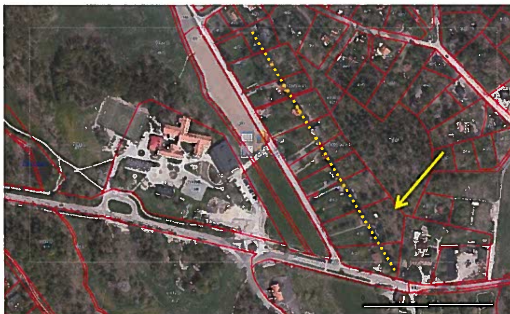
Byggnadernas placering mellan dalgången och bergryggen markerad med orange prickad linje.

Mer ingående gör de kulturhistoriska värdena att det inte är lämpligt att stycka fastigheten på ett sådant sätt att bebyggelsestrukturen förändras, som t.ex. om byggnadernas placering mellan dalgången och bergryggen skulle brytas. Fastigheten är därför inte lämplig att stycka i nord-sydlig riktning.