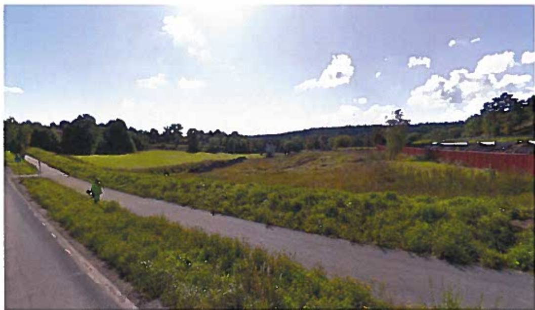
Dalgången vid Tjärnstigen sedd från Tyresövägen mot Tyresö slott.