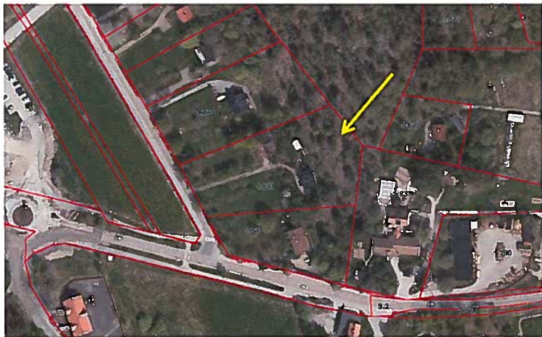
Aktuell fastighet Tyresö 1:537 markerad med gul pil.