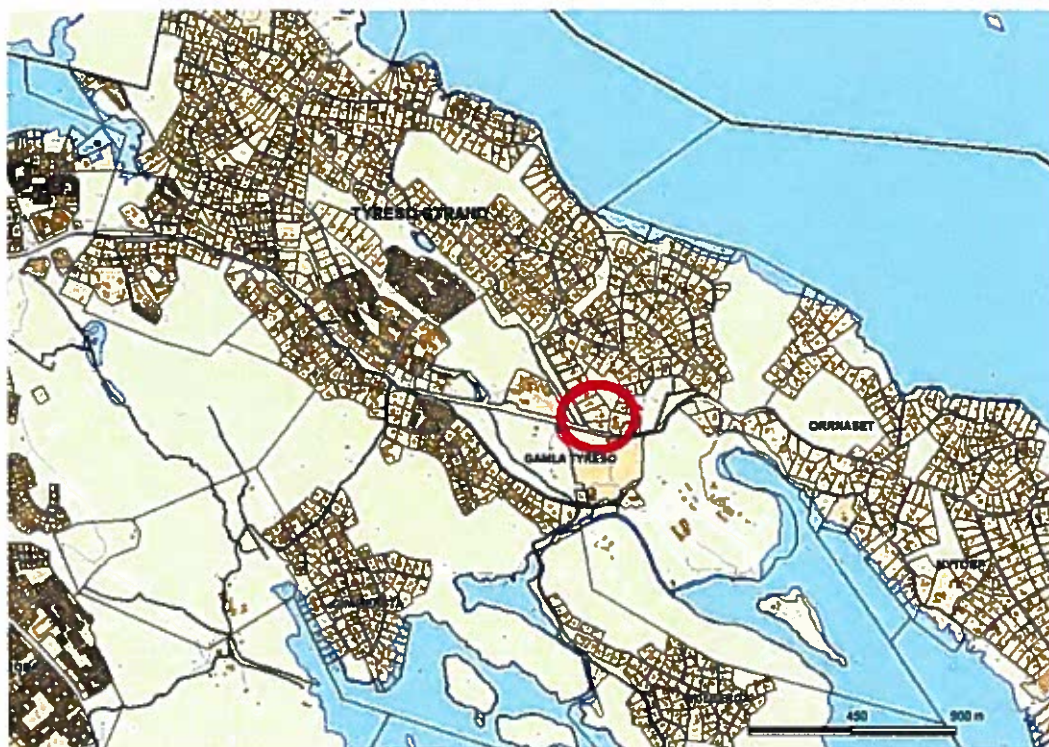
Fastighetens läge i kommunen vid Tyresövägen och Tjärnstigen.