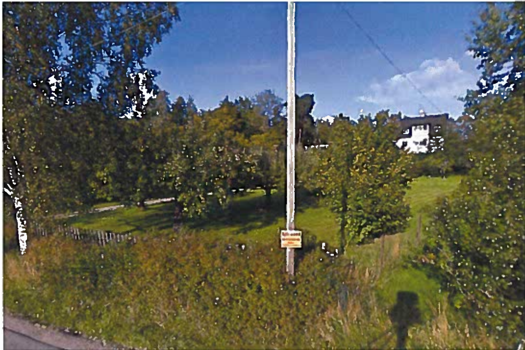
Fastigheten Tyresö 1:537 sedd från Tjärnstigen. Närmast vägen ses den för Tjärnstigen karaktäristiska fruktträdsbevuxna tomten.