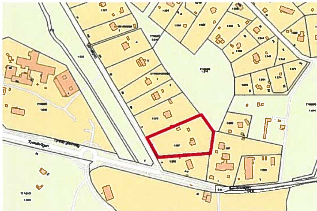
Aktuell fastighet Tyresö 1:537 markerad med röd linje.