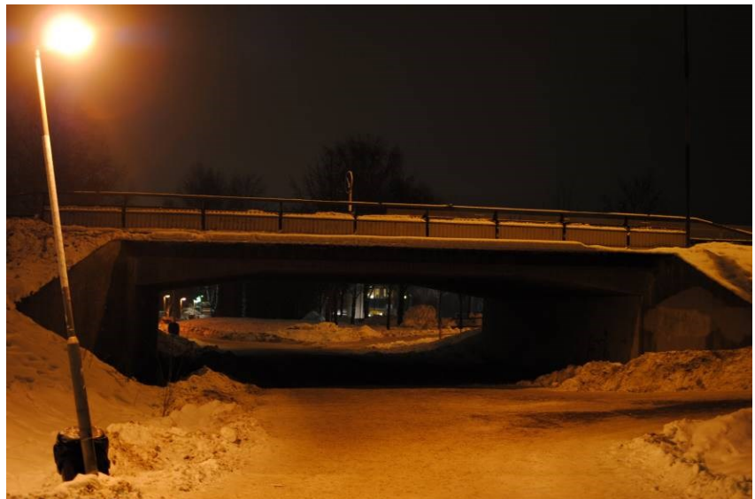
Gångtunnel med trasig belysning skapar otrygghet.

Släckta lampor, sönderslagna armaturer och nerklottrade stolpar bidrar till att skapa en otrygg miljö. Ett fungerande underhåll där trasig belysning snabbt blir åtgärdad är av största vikt för trygghetskänslan.