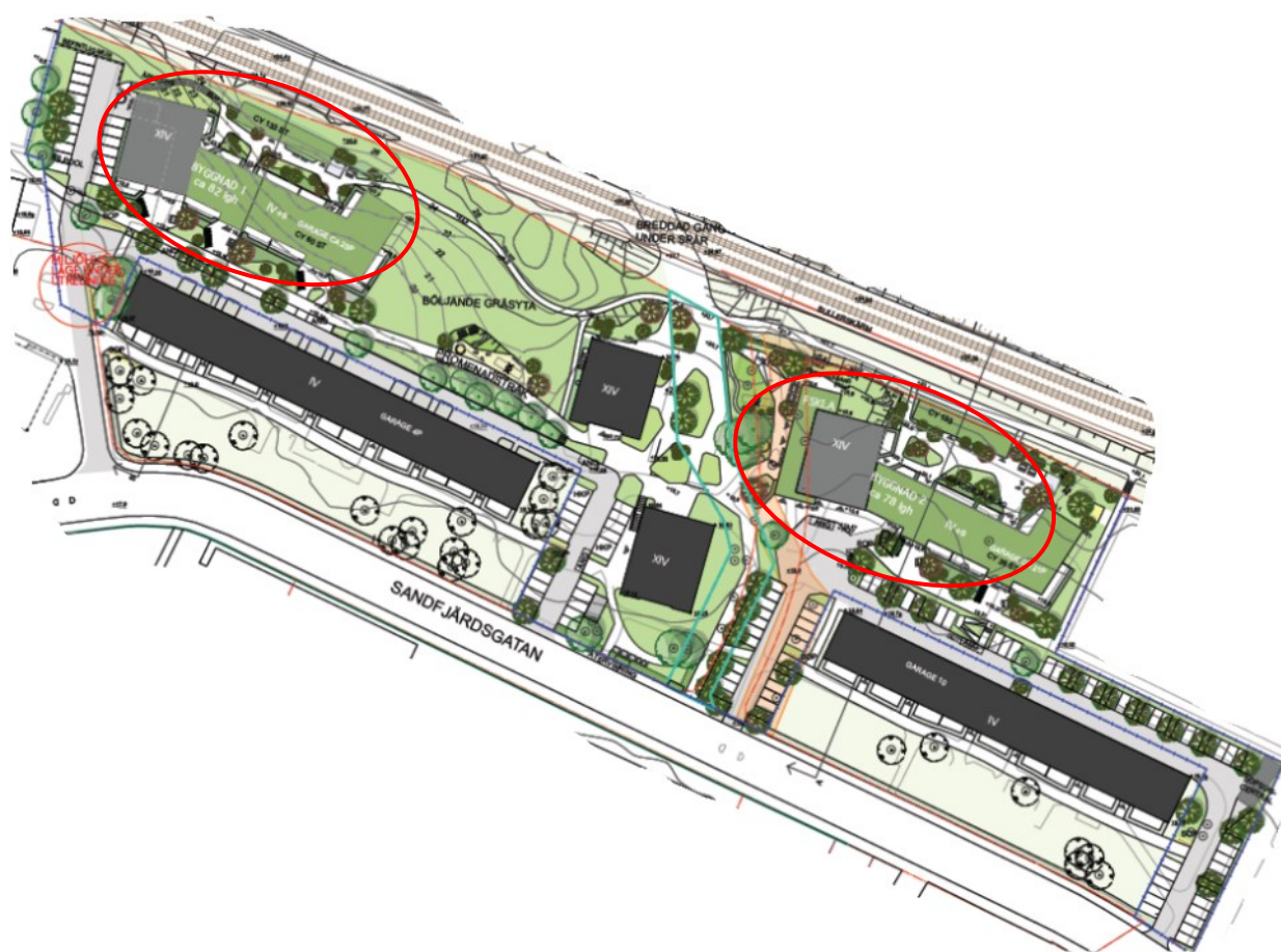
Bild: Befintliga hus är mörkgrå och planerad nyproduktion är grå (högdal) och grön (lågdel med sedumtak). Stor omsorg har lagts på lägenhetsutformning med ambitionen att genomgående skapa attraktiva lägenheter med bra planlösningar, ljusinsläpp och tillgång till balkong eller uteplats. En hög kvalitet planeras avseende den upplevda kvaliteten.

De nya huskropparna utformas som två s.k. Hybridhus d.v.s. ett punkthus om 14 våningar som sammankopplas med en lamell i fyra våningar med suterräng. Gestaltningen av husen har tagit fasta på den tidigare bebyggelsen i området. I området skapas 160 nya moderna hyresbostäder i en heterogen miljö bestående av både gamla och nya hus. Vidare skapas en ny förskola med fyra avdelningar. Bilparkering för de boende anordnas genom att garage förläggs under de nya husen samt anläggande av fyra platser för bilpool.