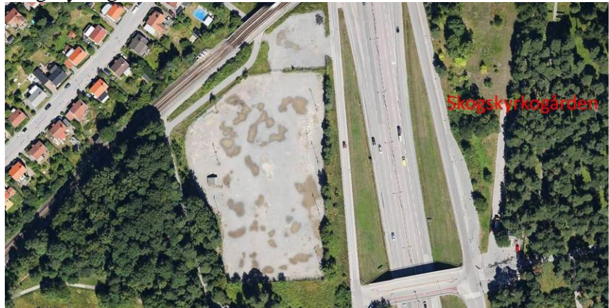
Satellitbild: Tallkrogens bollplan med omgivning

Tallkrogens bollplan utgörs av en grusyta med ungefärliga mått 130 m x 65 m. Den begränsas i söder och väster av cykel-/gångstråk och talldunge, i norr av cykel-/gångstråk och tunnelbana, och i öster av slänten upp mot Lingvägen, som på platsen utgörs av en enkelriktad ramp upp från Nynäsvägen. På andra sidan Nynäsvägen ligger skogskyrkogården.