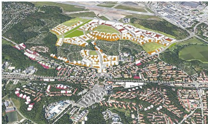
Programförslag, vy från 3D-modell.

I södra Riksby, Åkeshov, Åkeshov och Åkeslund föreslås viss förtätning genom kompletteringsbebyggelse i befintliga stadsdelar.