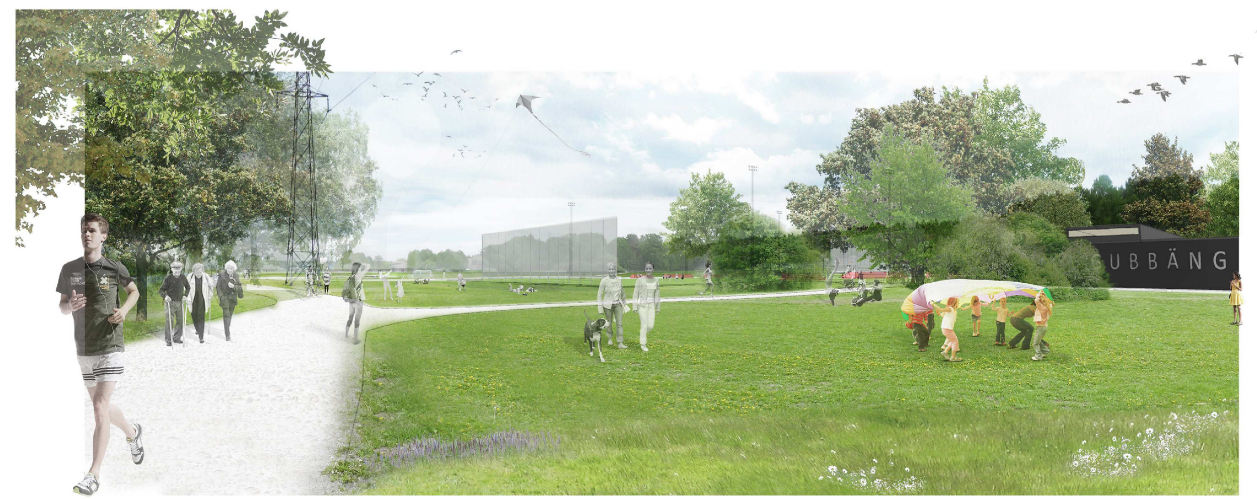
Vy från Lingvägen som visar konstgräsplan och servicebyggnad. Perspektiv och vidstående illustrationskarta är framtagna av Andersson och Jönsson Landskapsarkitekter.