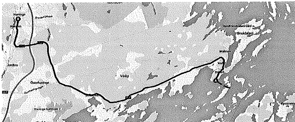
Figur 2 Föreslagen linjesträckning för linje 869.