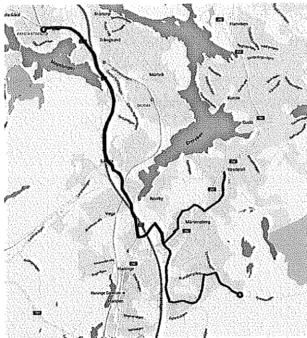
Figur 1 Föreslagen linjestäckning för linje 806 i rött samt linje 809 i blått.