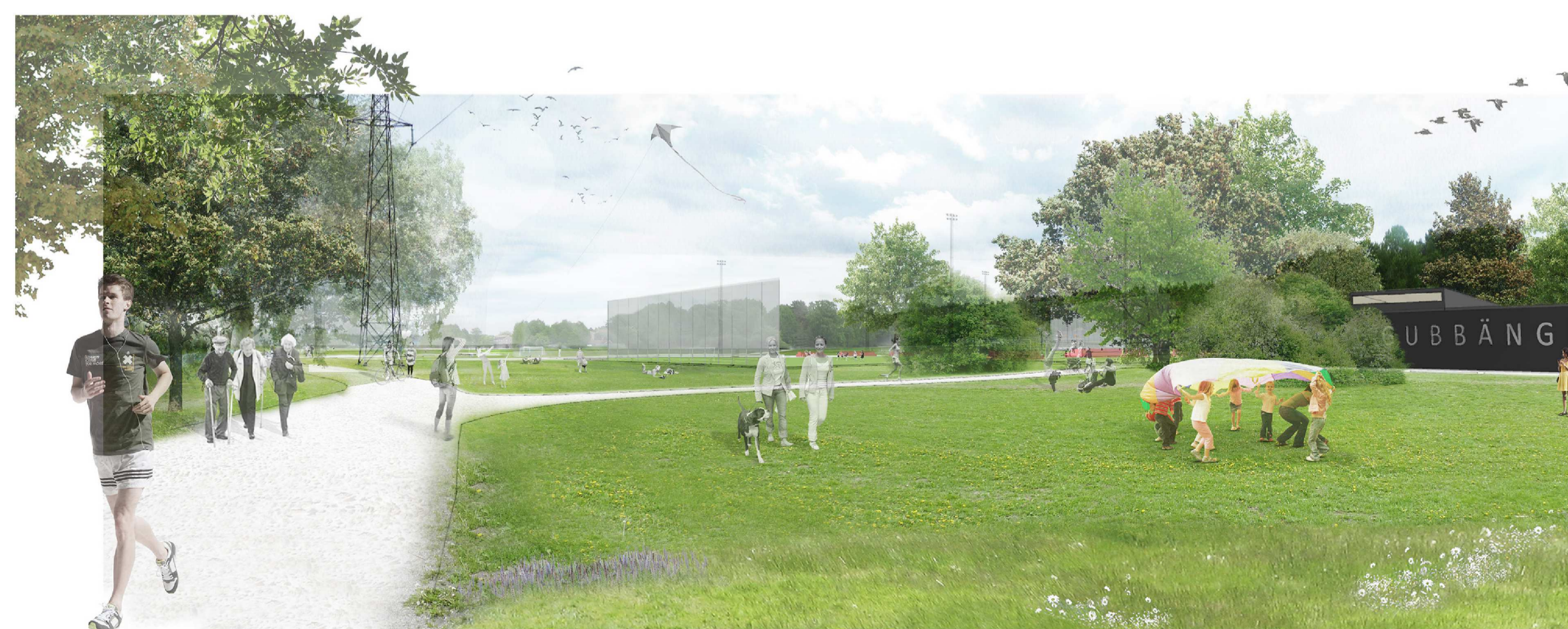
Vy från Lingvägen som visar konstgräsplan och servicebyggnad. Perspektiv och vidstående illustrationskarta är framtagna av Andersson och Jönsson Landskapsarkitekter.