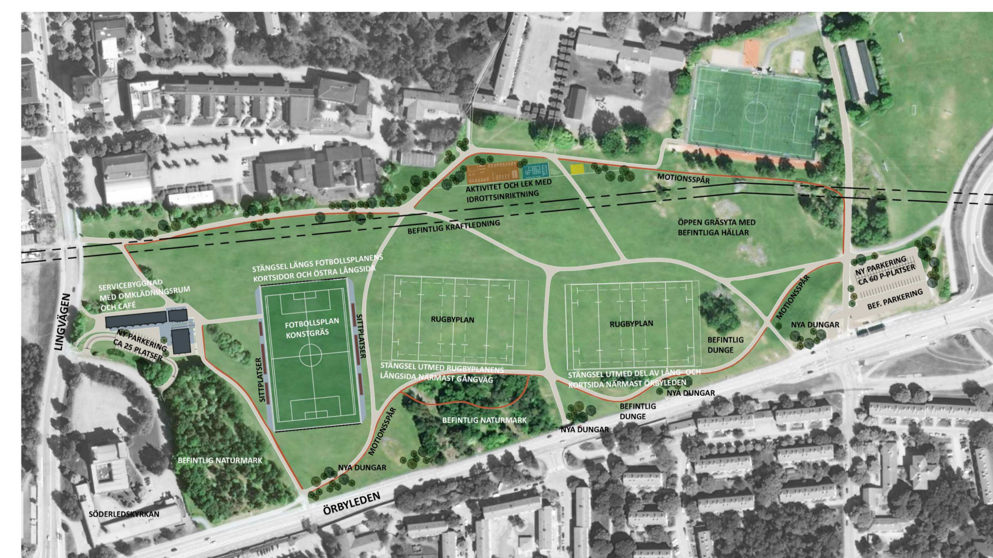
10 0 50m Skala 1:1000, utskriftsformat B1