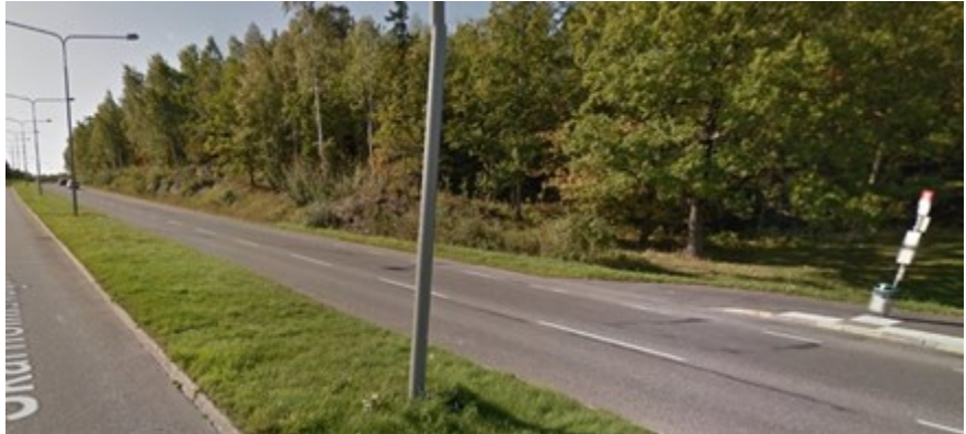
Skärholmsvägen innan ombyggnad med 1+1 körfält samt cykelfält i vägren.