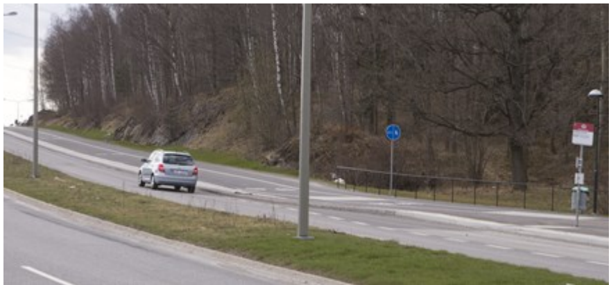
Skärholmsvägen efter ombyggnad med 1 körfält + gc-bana med säkerhetszon.