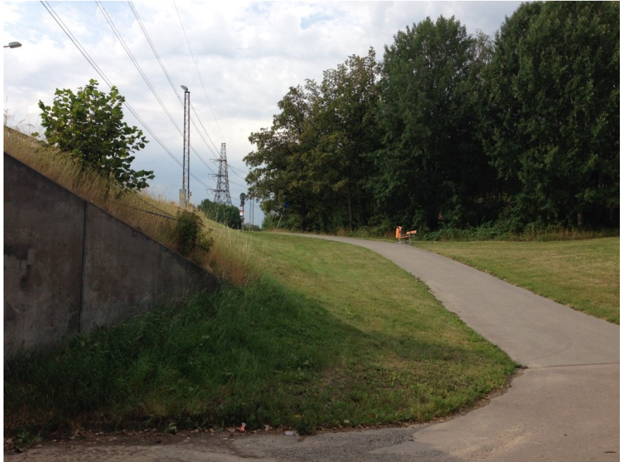
Anslutande parkväg innan ombyggnation.

Vid Ekholmsvägen har den befintliga parkvägsanslutningen upp på Skärholmsvägen breddats och kompletterats med räcke och belysning.