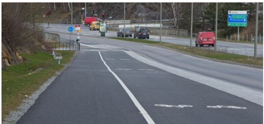
Skärholmsvägen efter ombyggnad med 1 körfält + gc-bana med säkerhetszon