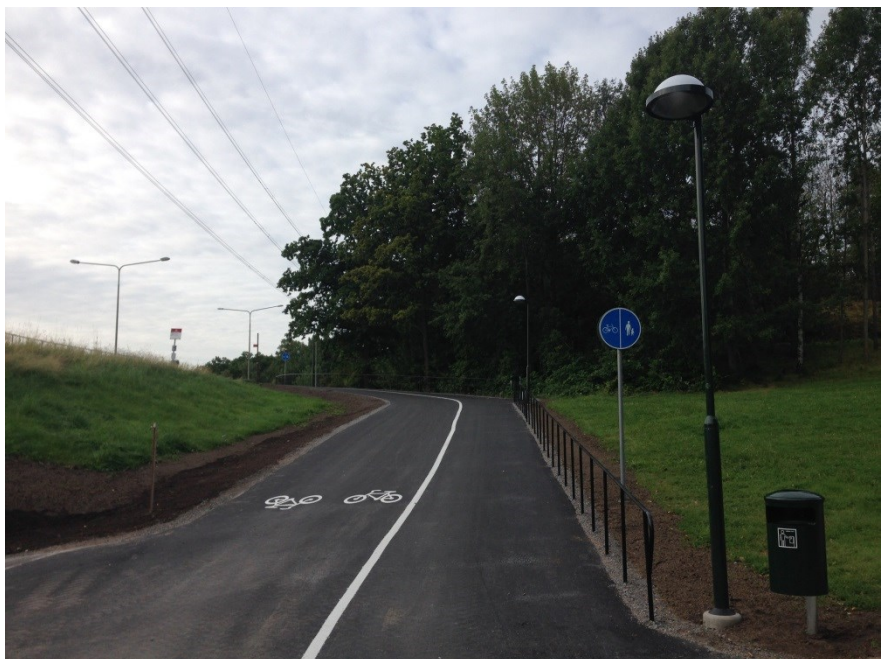
Anslutande parkväg efter ombyggnation.