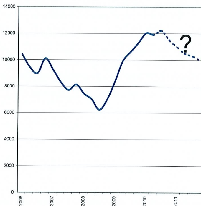
Figur 1. Arbetslöshetens utveckling för Södertörnskommunerna inklusive prognos för närmaste framtiden, baserad på Konjunkturinstitutets senaste analys som spår minskad arbetslöshet från hösten 2010. Personer i arbetsmarknadsåtgärder ingår ej i figuren.