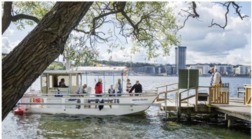
Färjan angör bryggan i Tanto

Färjetrafiken upphandlas i enlighet med reglerna i LOU. Kriterierna för anbudsutvärderingen formuleras så att eldrivna fartyg gynnas.