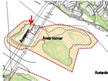
Skyddsföreskrifter för Årsta Holmar

" Under tiden 1 april-31 juli är det förbjudet att ankra, landstiga, befara eller beträda markerat område [gulskryssat i kartutdraget nedan, min notering] på Årsta holmar enligt beslutscharta, med undantag av anvisade stigar eller platser."