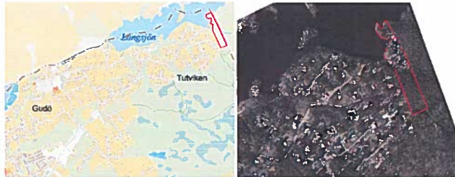
BILD: Planområdet i rött till höger i bilderna nedan.

Syftet med planarbetet är att möjliggöra avstyckning av fastigheterna med ett utökat antal byggrätter för bostadsändamål.