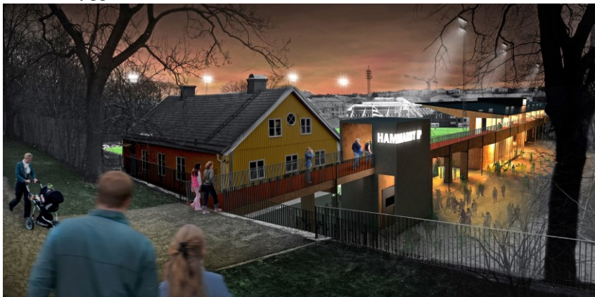
Ny entré till Kanalplan och västra läktaren.