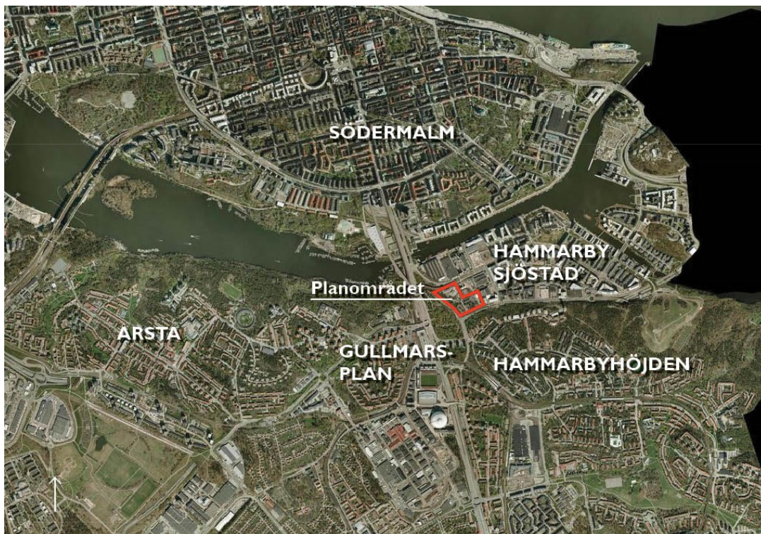
Planområdets läge i västra delen av Hammarby Sjöstad.

Stadsbyggnadskontorets tjänsteutlåtande daterat den 12 april 2016 har i huvudsak följande lydelse.