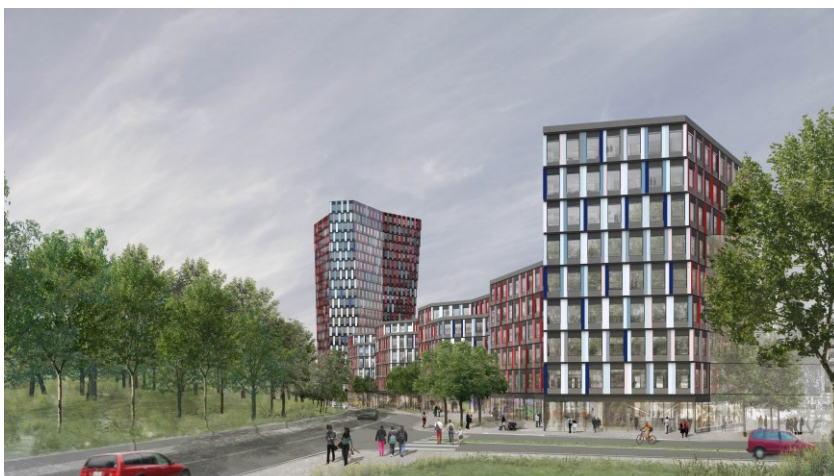
Illustrationer över kontorsbebyggelsen från nordväst samt från Hammarbybacken söderut. Illustration: Sauerbruch Hutton