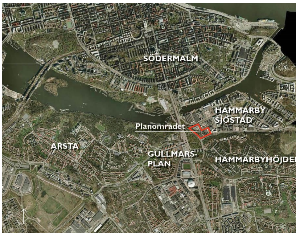
Planområdets läge i västra delen av Hammarby Sjöstad.

Stadsbyggnadskontorets tjänsteutlåtande daterat den 12 april 2016 har i huvudsak följande lydelse.