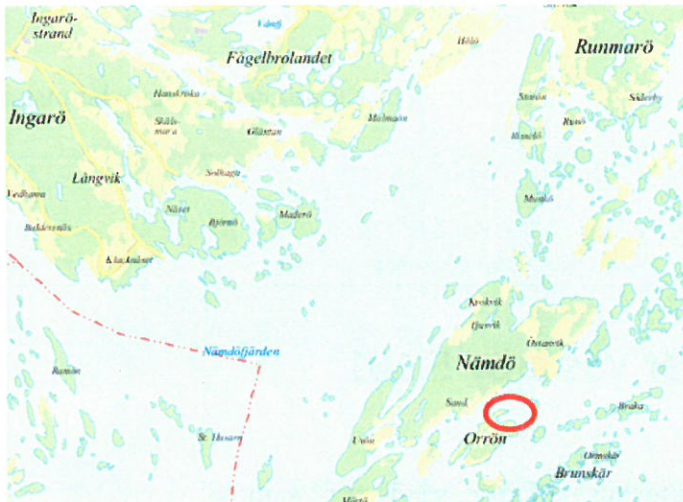
Fig 1. Översiktskarta. Orrön ligger öster om Nämndö.