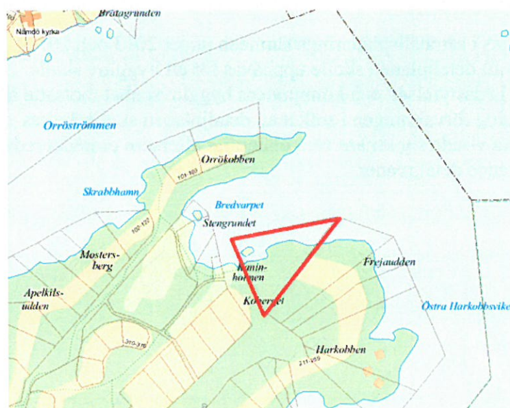
Fig 2. Kartan visar planområdet med den berörda fastigheten Västerby 5:101 på Orrön.

Detaljplanen bedöms bli antagen första kvartalet 2017.