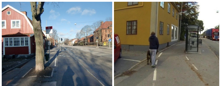
Bild 2. Begränsad framkomlighet och trafiksäkerhet samt konflikt mellan gående och cyklister där gångbanan upphör och gående tvingas ut i cykelbanan.

Gång- och cykelbanan är idag smal och innehåller flera fasta hinder som stolpar och träd. Flertalet av korsningarna och utfarterna på sträckan är dåligt utformade. Fördröjningar uppstår på ett antal platser på grund av dålig kontinuitet, begränsad sikt, tvära kurvor och smala sektioner där cyklister måste samsas om utrymmet med fotgängare. Framkomligheten påverkas också av dålig beläggning på delar av sträckan.