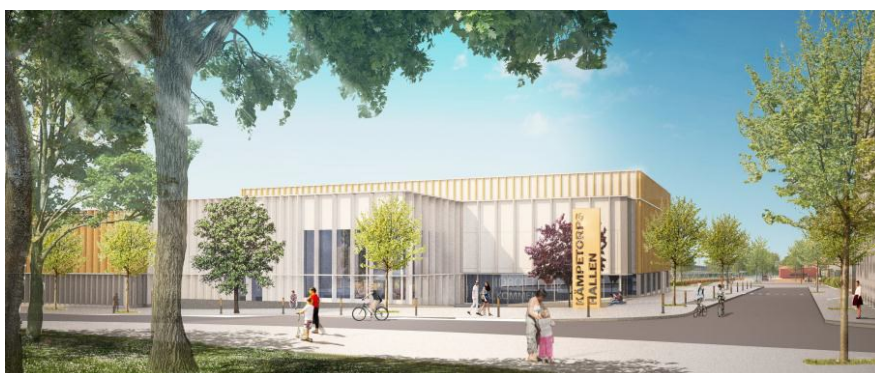
Illustration av entrén till Kämpetorpshallarna, hämtad ur planbeskrivning.

I den nya detaljplanen ingår för idrottens del en idrottshall med två fullstora verksamhetsytor samt en 11-spels konstgräsplan. De två verksamhetsytorna i hallen har måtten 24 x 43 meter vardera, och är sammanlänkade av en servicedel. Servicedelen är en tvåvåningsbyggnad som förutom omklädningsrum, förråd och driftytor för idrottshallen även inrymmer en avgränsningsbar del med omklädningsrum och förråd för konstgräsplanen. Konstgräsplanen har totalmåtten 102 x 66 meter, vilket ger godkända spelmått för ungdomsmatcher (98 x 60 meter).