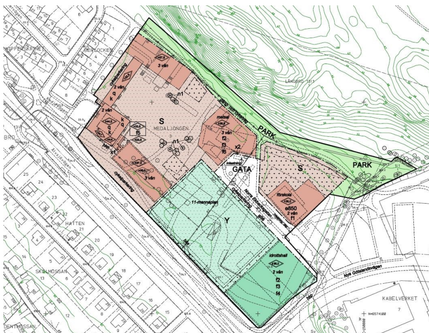
Föreslagen plankarta för området Medaljongen 3 m fl.