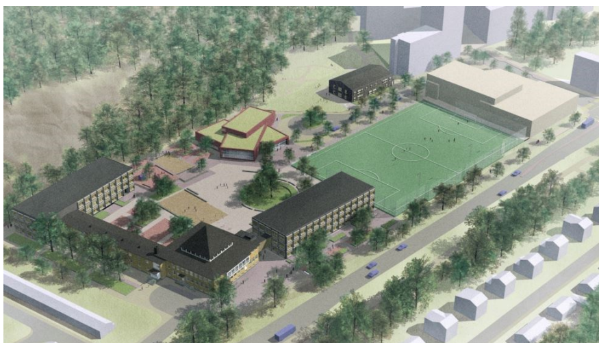
Illustration av det nya området kring Kämpetorpsskolan, hämtad ur planbeskrivning.

I den nya detaljplanen ingår för idrottens del en idrottshall med två fullstora verksamhetsytor samt en 11-spels konstgräsplan. De två verksamhetsytorna i hallen har måtten 24 x 43 meter vardera, och är sammanlänkade av en servicedel. Servicedelen är en tvåvåningsbyggnad som förutom omklädningsrum, förråd och driftytor för idrottshallen även inrymmer en avgränsningsbar del med omklädningsrum och förråd för konstgräsplanen. Konstgräsplanen har totalmåtten 102 x 66 meter, vilket ger godkända spelmått för ungdomsmatcher (98 x 60 meter).