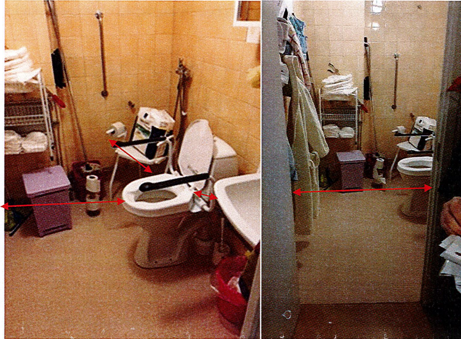
Toalett på avdelning Vitsippan

Ni har i era undersökningar konstaterat att dörröppningar in till rummen/lägenheterna saknar 0,9 meter fritt öppningsmått.